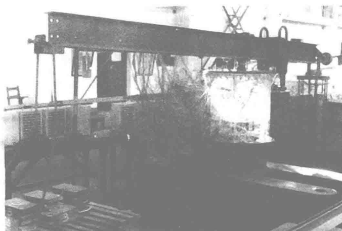
图1-1 唐山开滦煤矿的煤仓1:100有机玻璃模型试验

对于实际工程中处于不同条件的特种结构,例如海洋石油平台、核电站、仓储结构、网壳结构、地下洞室等,仅应用理论分析的方法是不够的,还要通过结构试验的方法进行验证,为实际工程提供设计依据。1976年唐山大地震中,开滦煤矿3000t容量的煤仓被震坏。煤仓的钢筋混凝土主体结构是由筒体、圈梁、折板形底板和立柱等组合而成的空间结构,是上世纪50年代由波兰政府援建的项目。为研究煤仓在地震中震坏的原因和重建新煤仓,采用原煤仓1:100的有机玻璃试验结构模型进行试验研究(如图1-1所示)。探索原煤仓在弹性工作阶段的设计内力及设计方法存在的缺陷,结构各部件的设计应力与变形是否超出设计允许范围,并探测仓储结构的自振频率。