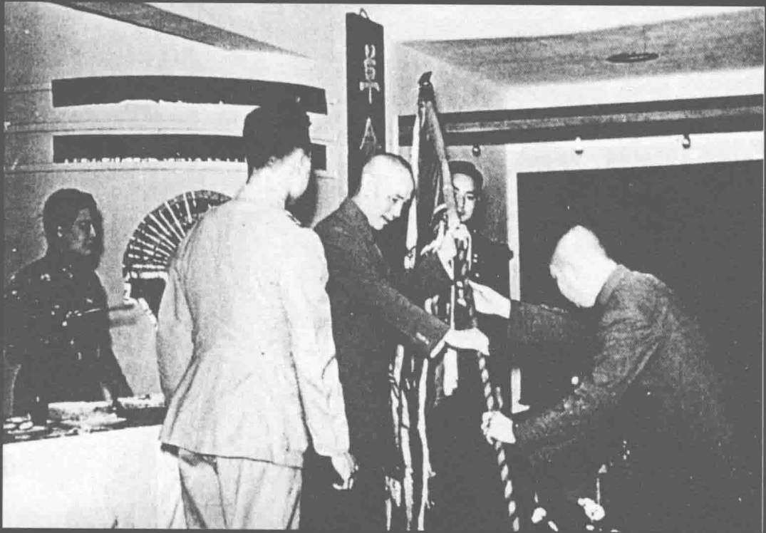
“还都”前，国民政府在重庆举行交接仪式