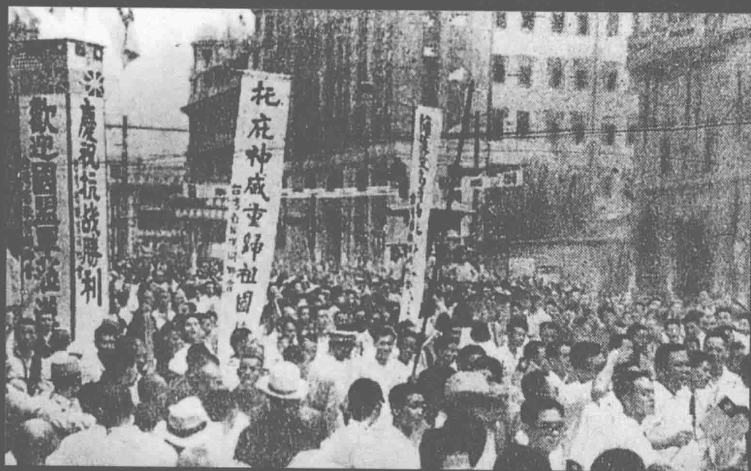
武汉人民庆祝抗战胜利