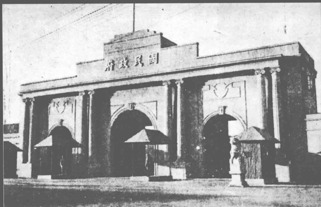
西迁前的国民政府