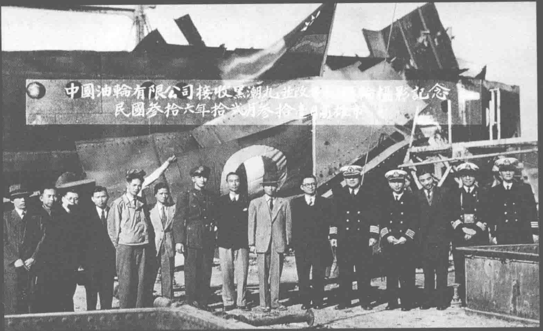
國民政府接收的日本油輪