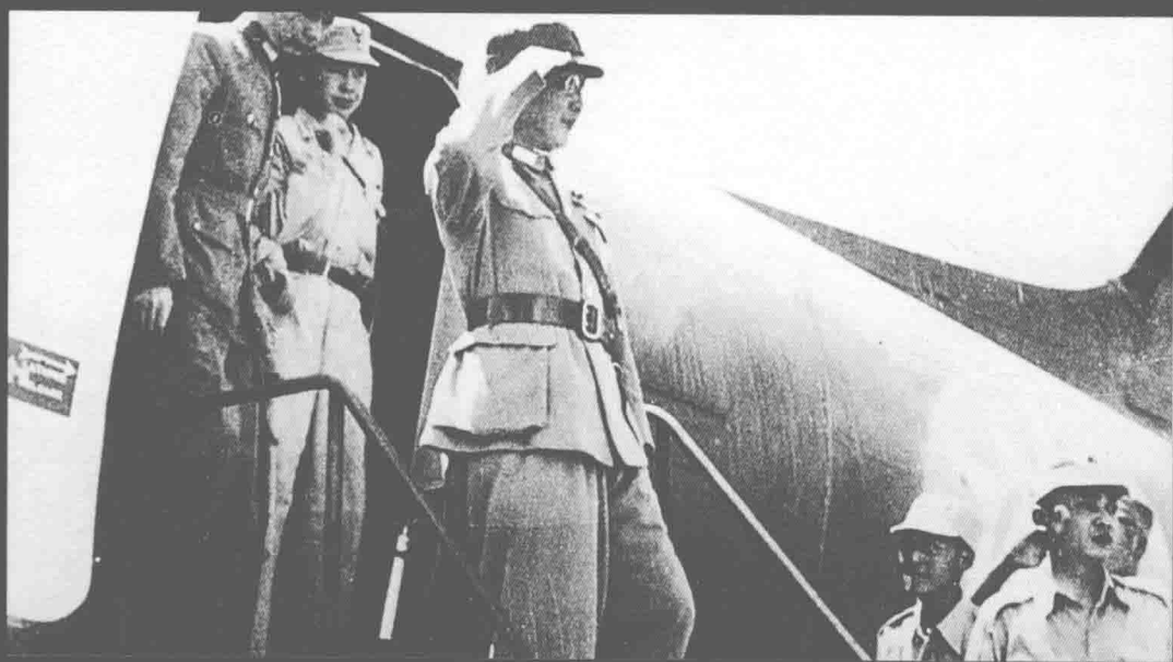
陆军总司令何应钦到达南京