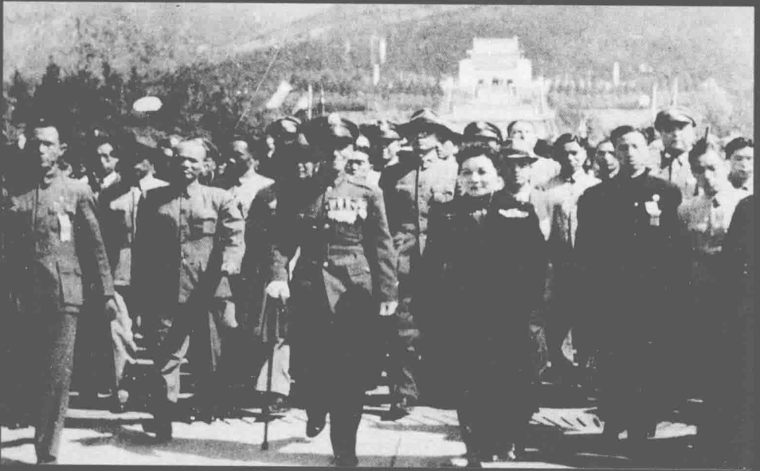
蒋介石和宋美龄走下中山陵