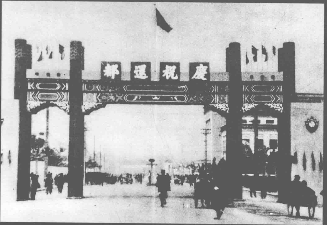
还都时在南京街头建造的牌楼