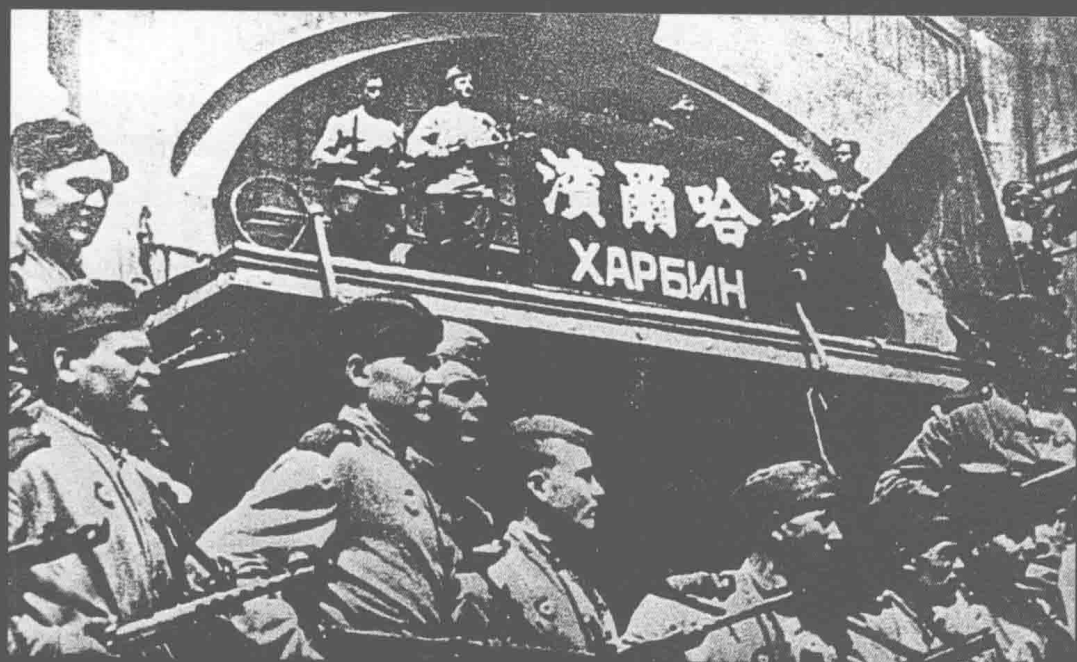
苏联红军进入哈尔滨