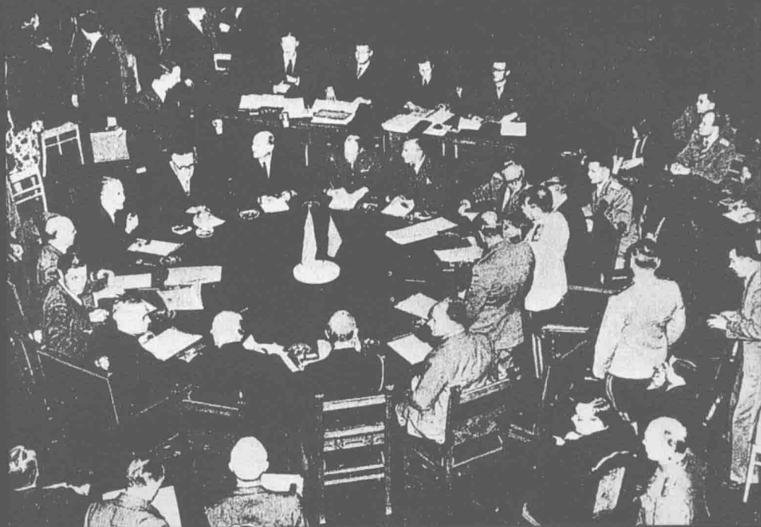
德国波茨坦会议会场