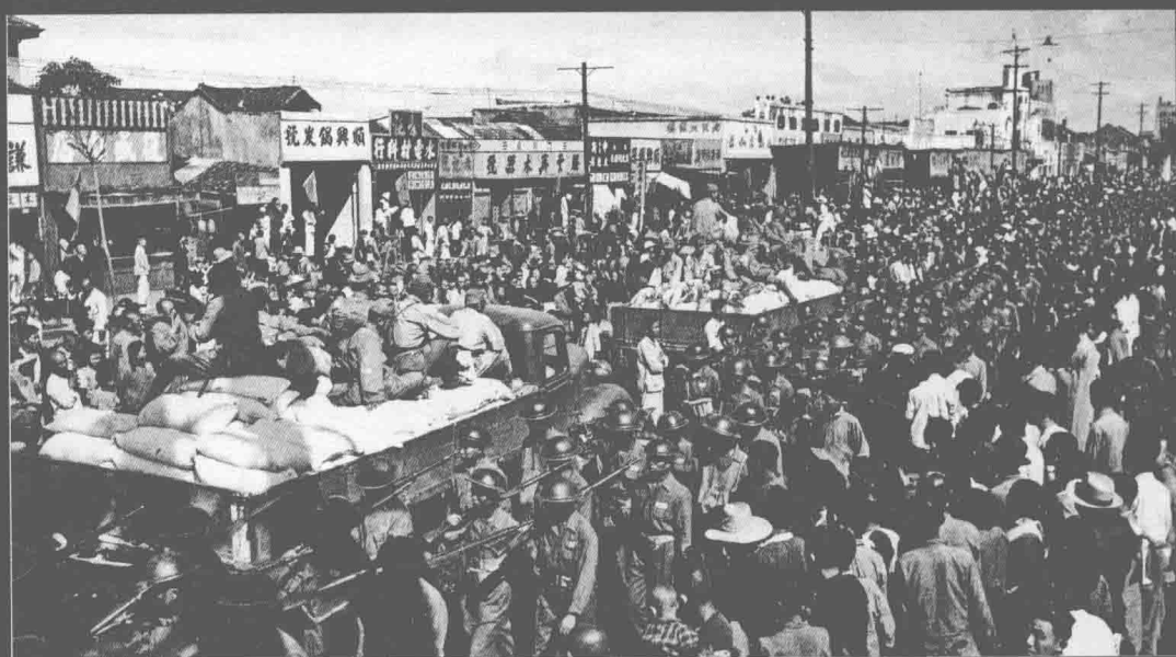
新六军与日军擦肩而过