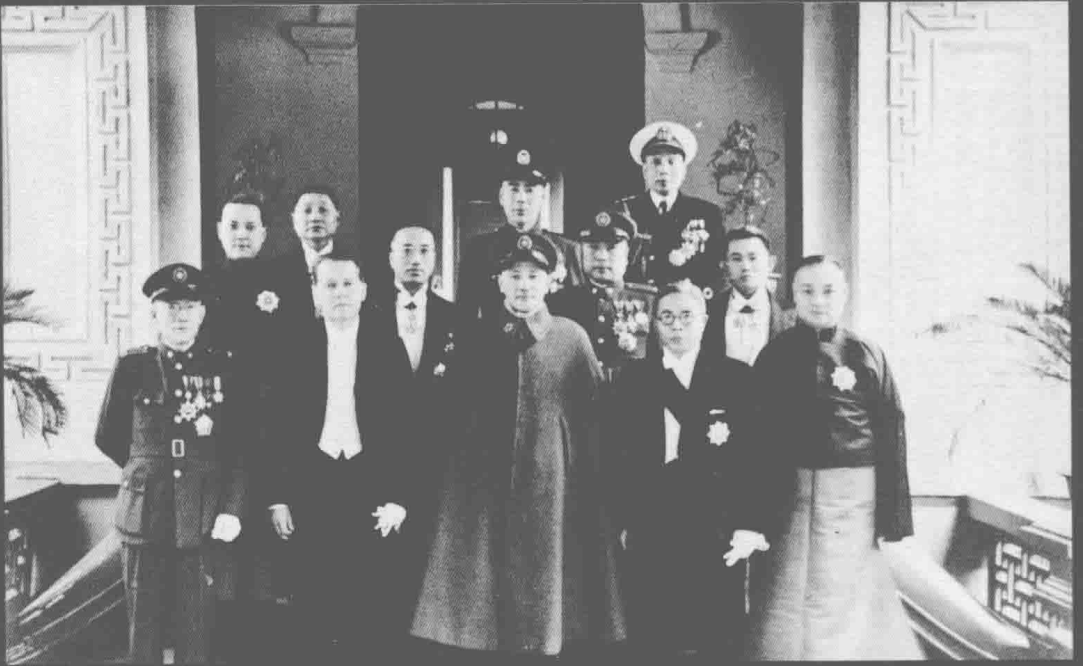
蒋介石在总统府接见宾客