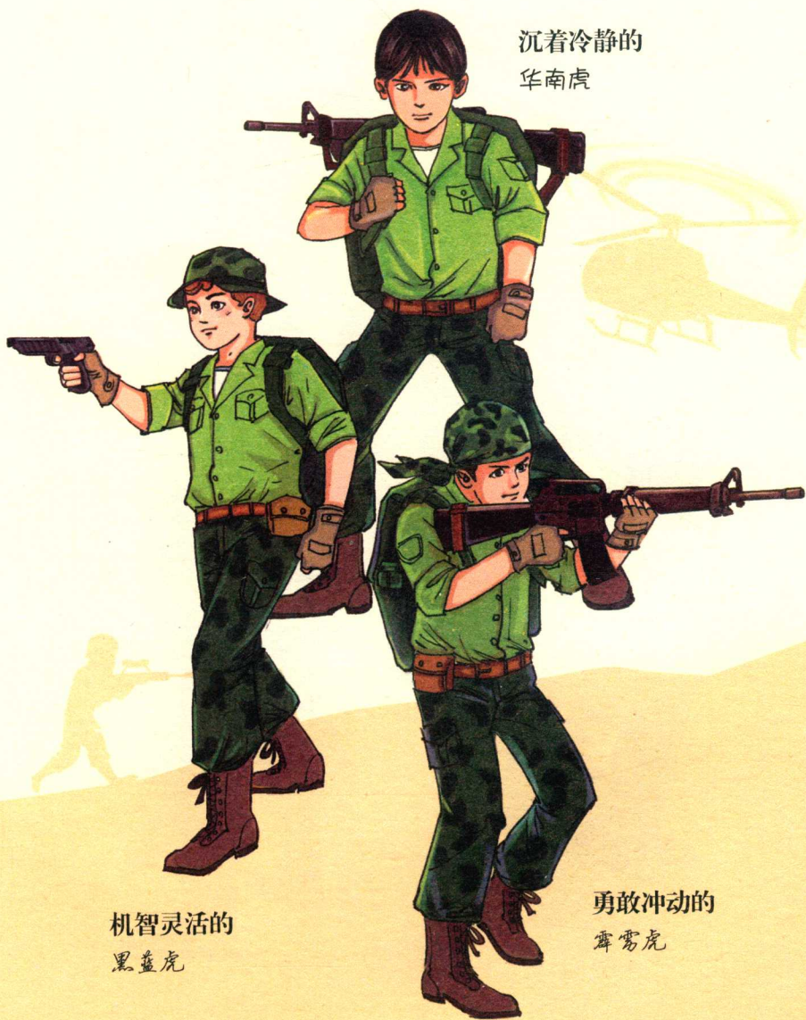
机智灵活的 黑蓝虎