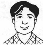
タワポン にほんごがっこう 日本語学校の がくせい 学生