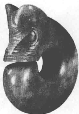
图 1.2 猪龙