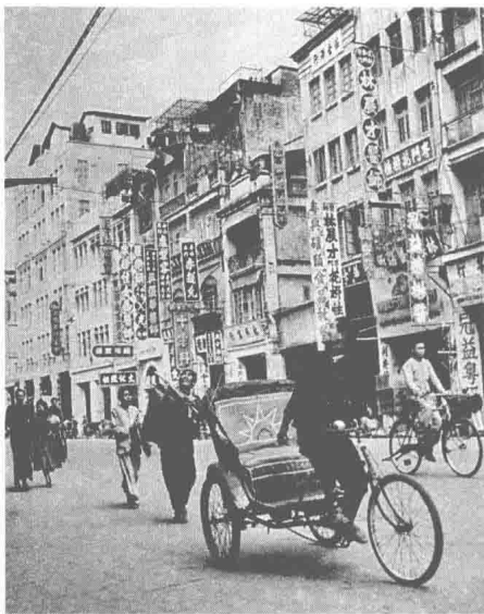
太平南路，即现今的人民南路，1949年3月