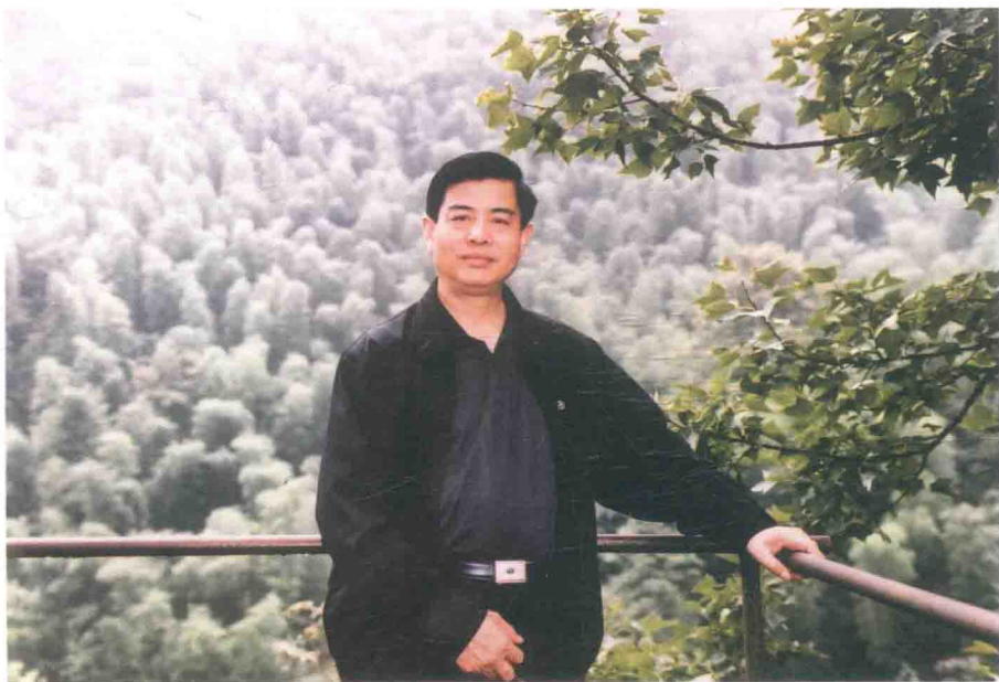
2008年春摄于井冈山竹林