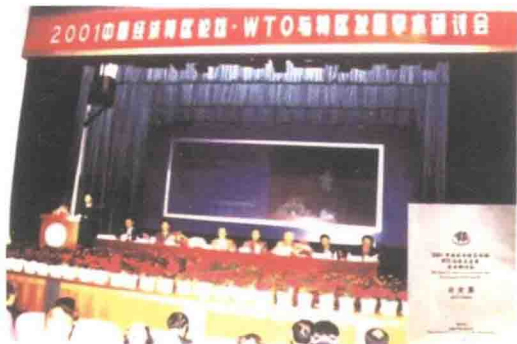
每年一次的“中国特区论坛”，影响广、收效大