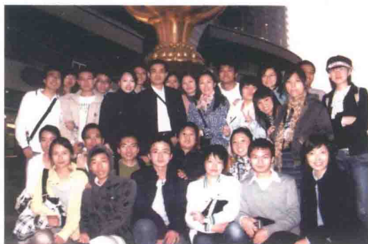
与部分老师带深圳大学2007届金融专业 硕士到中国银行香港分行参观留影