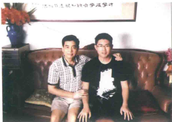
大孙子 2016 年由深圳国际交流学院毕业后 考上伦敦大学，攻读商业信息管理专业