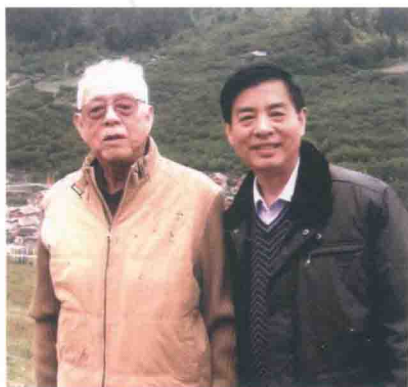
与金融泰斗黄达教授