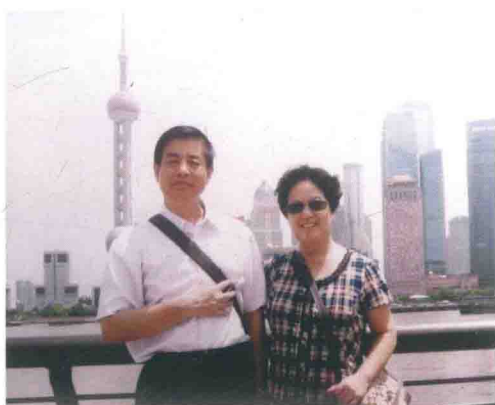
我的老伴一辈子从事银行、财务工作