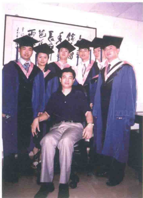
在深圳大学指导的首届 金融学专业硕士