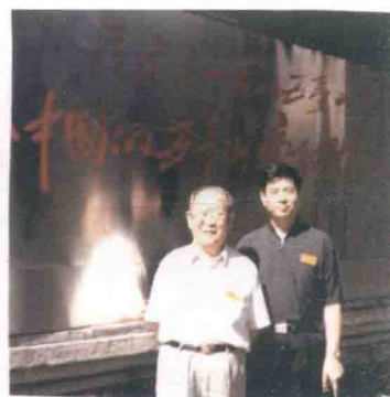
与著名金融学家赵海宽教授