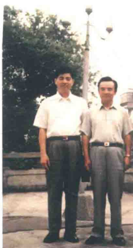
与著名经济金融学家刘鸿儒教授