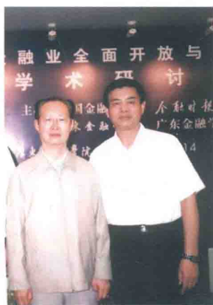
与学长著名金融学家曾康霖教授