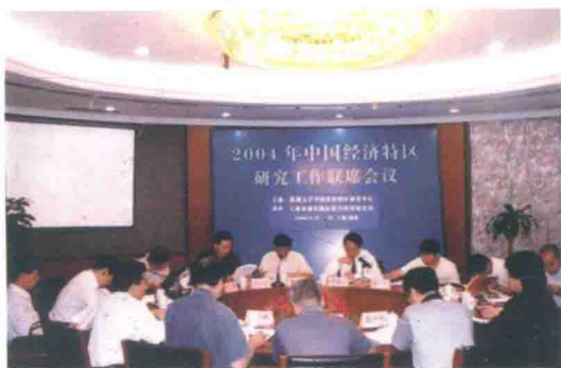
每年一次的中国特区联席会议， 2004年在上海浦东新区召开