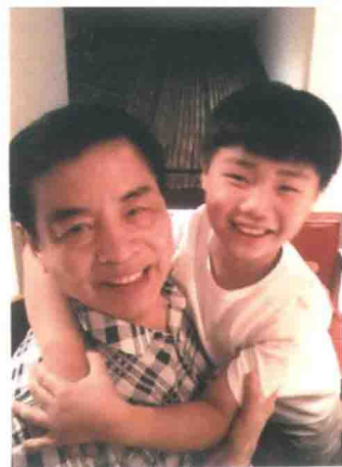
小孙子夸口说将来也要 跟爷爷学金融