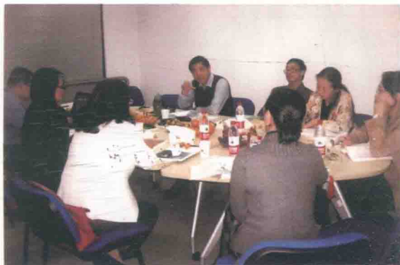
主编《金融学》教材发行量达80多万册， 为精益求精，多年来编写组到10多所高校 开展调研，深入了解师生们的需求和意见