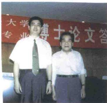
与著名金融学家江其务教授