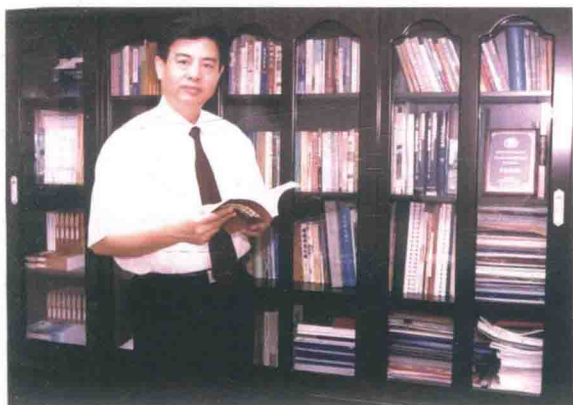
我一生从事金融教学和研究