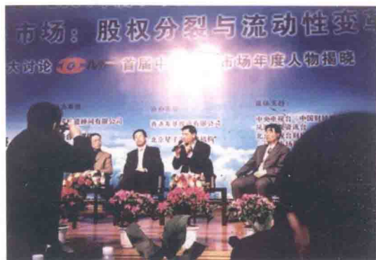
应邀参加学术研讨会并做嘉宾发言