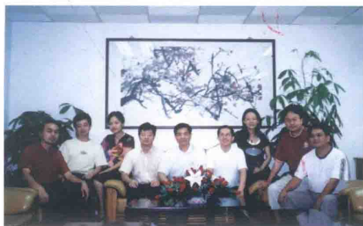
与中国人民大学和中南财经政法大学的 博士生们在深圳大学授课后的留影