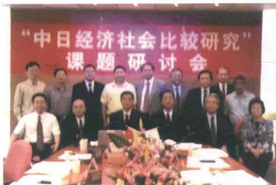
中日两国专家们合作开展跨国课题研究