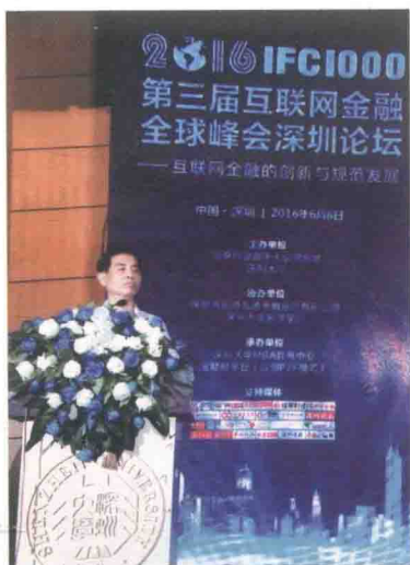
在互联网金融峰会深圳论坛上做嘉宾发言