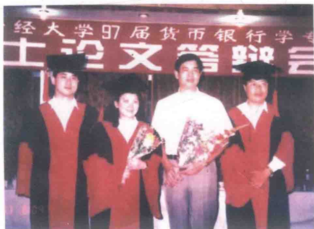
指导中南财经政法大学首届（1997届） 3位博士喜获金融学专业博士学位