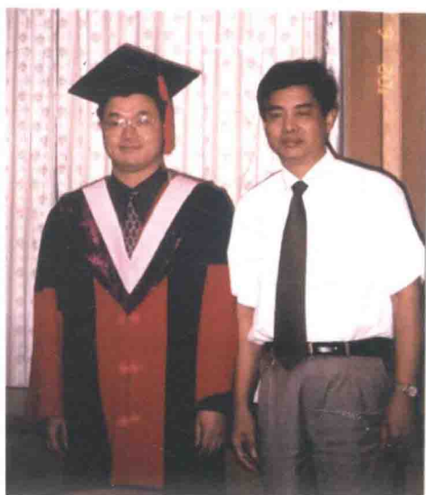
指导刘桂平博士（现任重庆市副市长）喜获 中南财经政法大学金融学专业博士学位