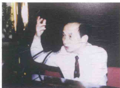
最爱听著名金融学家张亦春教授生动而直率的发言