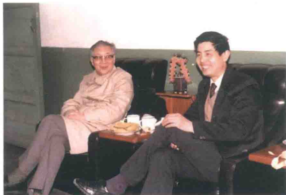
与导师著名金融学家周骏教授