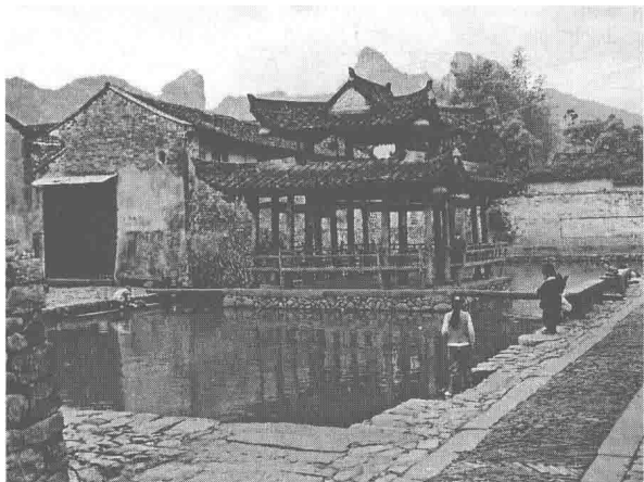
图1.7 楠溪江芙蓉村中心,讲者摄于芙蓉村