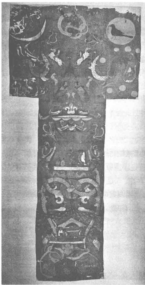
图1.1 [汉]马王堆1号墓出土非衣，选自《中国历代艺术》

中华民族认为，万物同情同构，人、自然生物与人造物之间有一种冥冥的联系，人造物也被人赋予了灵魂与生命。古代有一种器皿叫“象生器”，模仿葫芦、石榴、蒜头、南