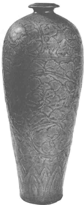
图1.3 [宋]耀州窑梅瓶,上海博物馆藏,选自《中国美术全集》