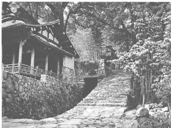
图1.8 楠溪江埭头村,讲者摄于埭头村