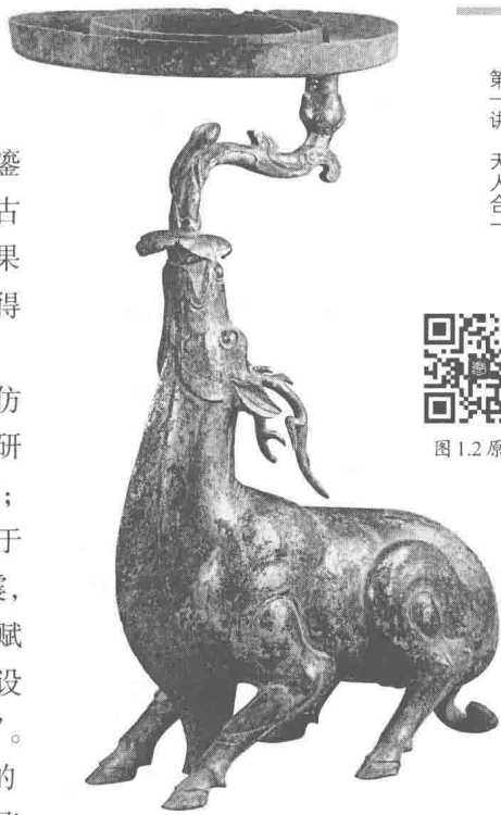
图1.2 [汉]盱眙大云山西汉墓出土鎏金鹿灯

各位必定去过北京,老北京城和城内古建筑正是“法天象地”的典范。朝阳门在城东,因为太阳从东方升起;阜成