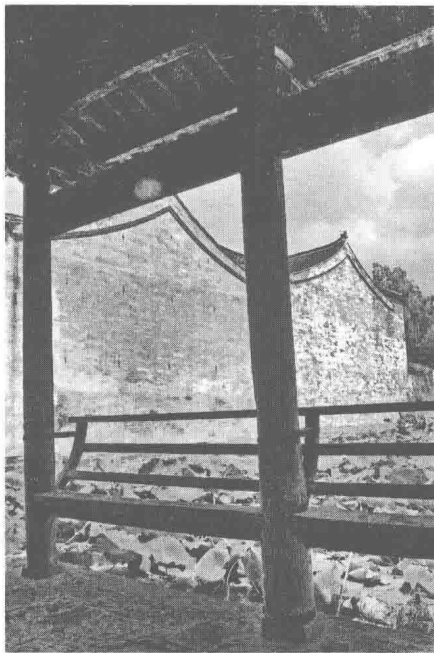
图1.6 [清]徽州西溪南村老屋阁绿绕亭,选自讲者《江南建筑雕饰艺术》

中国传统园林从始创之日开始,就体现出收天纳地的思想。“丘陵为牡,溪谷为牝”(《大戴礼记》),山是阳,水是阴,阴阳交合,构成中国园林的基本骨架。明清,园林成了“壶中天地”,士大夫“不出户而壶天自春” ① 。苏州保存着明代文震亨设计的园林,叫艺圃,很小的空间,也以写意的手法收天纳地(图1.9)。知道文震亨是谁的弟弟吗?你们高中都学过《五人墓碑记》,“郡之贤士大夫请于当道,即除魏阉废祠之址以葬之”,“郡之贤士大夫”指文震孟,就是文震亨的哥哥。文震亨写了本书叫《长物志》,对中华园林之美有独到的论述。清代李渔称自己的私园叫“芥子园”,“取芥