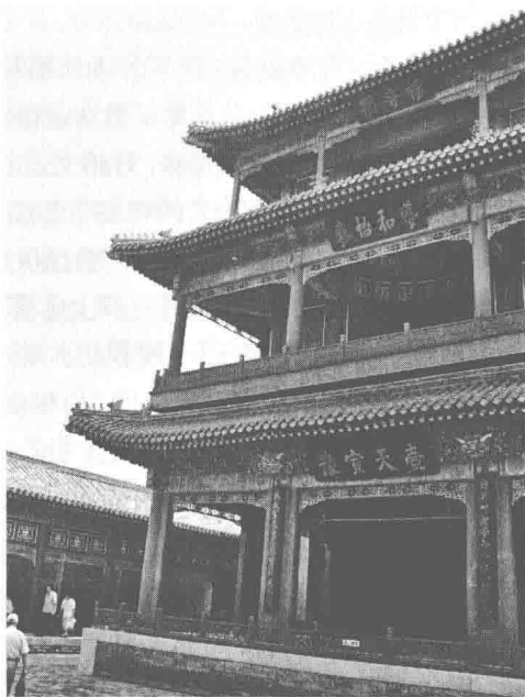
图 1.4 [清]北京故宫内戏台,讲者摄于北京

李约瑟在考察中国古代建筑之后说,“再没有其他地方表现得像中国人那样热心于体现他们伟大的设想‘人不能离开自然’的原则……皇宫、庙宇等重大建筑物自然不在话下,城乡中不论集中的,或者散布于田庄中的住宅也都经常地出现一种对‘宇宙的图案’的感觉,以及作为方向、节令、风向和星宿的象征主义” ① 。