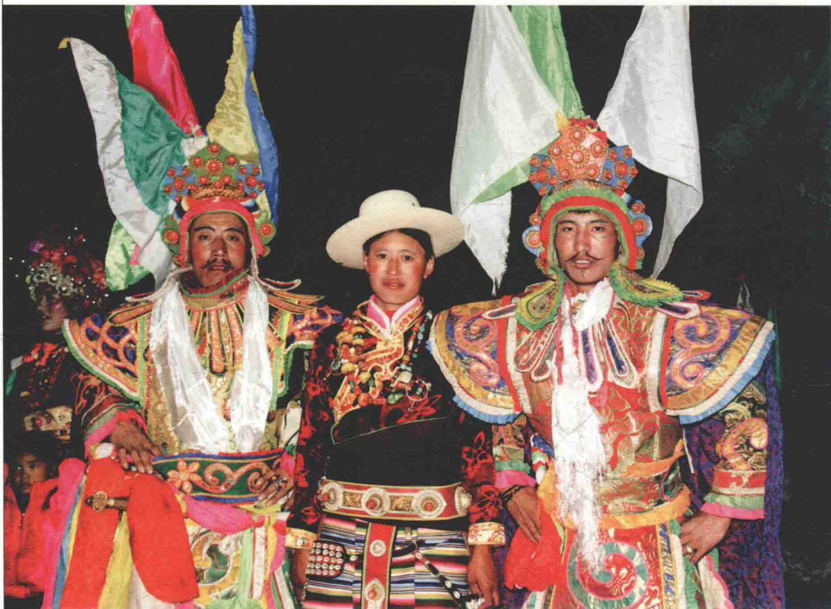
丹巴县丹东乡的藏戏演出现场