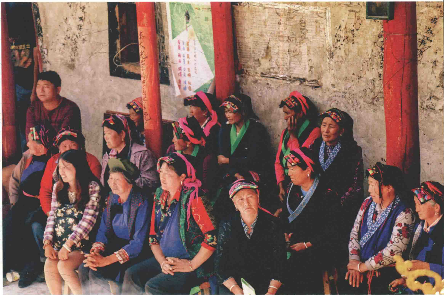
康定县麦崩乡的庙会