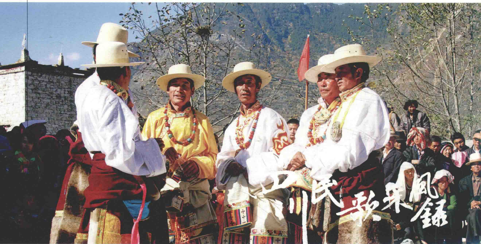
丹巴县东谷乡藏族男子的山歌演唱