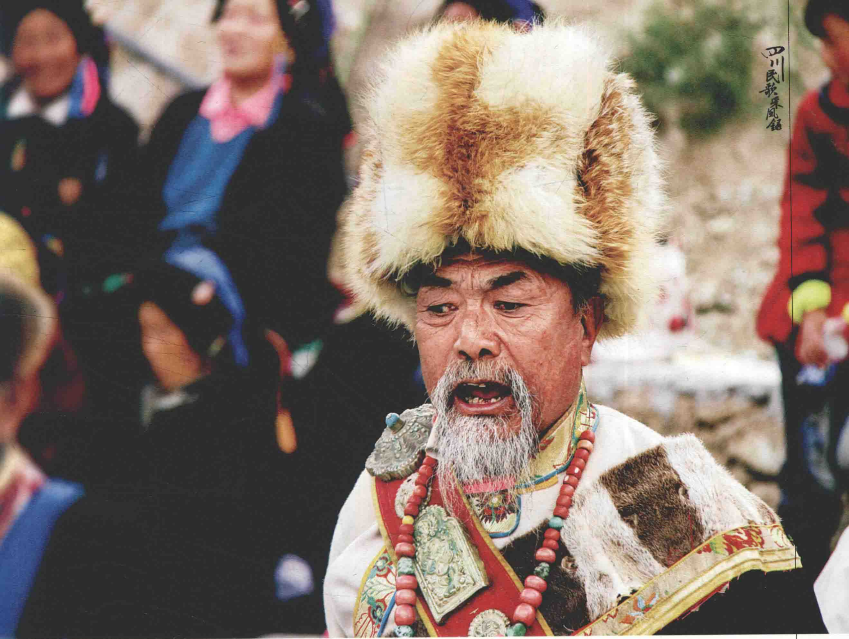
丹巴县甲居藏寨边舞边唱嘉绒锅庄的老歌手