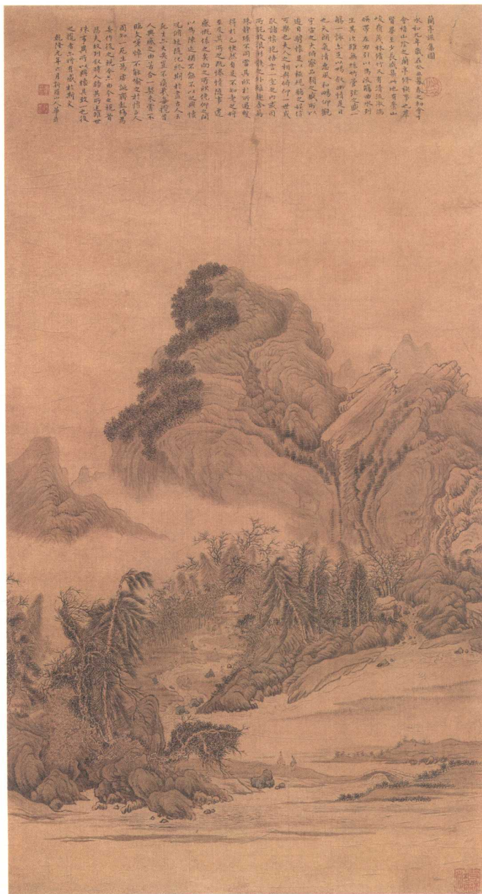
兰亭集图 | 109.4cm x 57.4cm