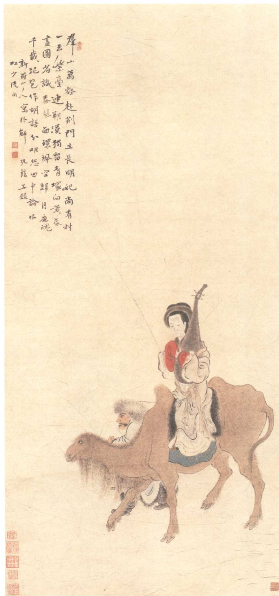
明妃出塞图 | 132.5cm × 63cm