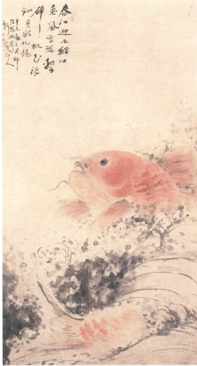
赤鲤图 | 170.7cm × 91cm