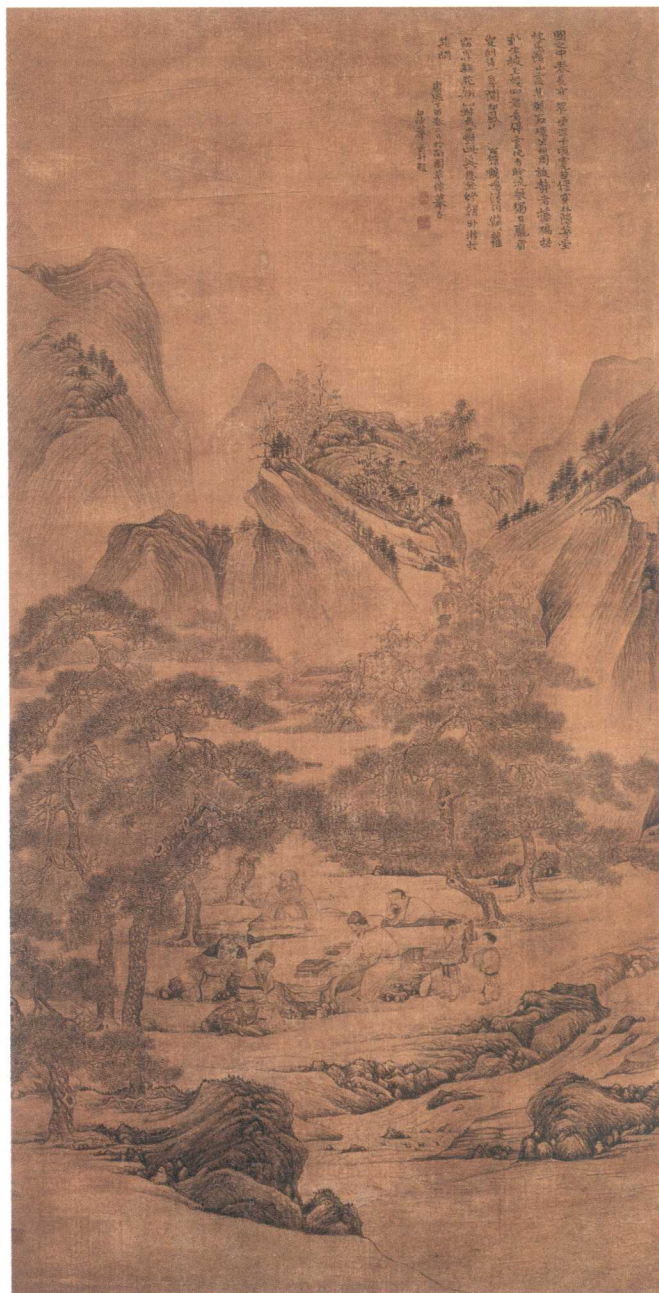
山客盘石图 | 139.6cm × 69.6cm