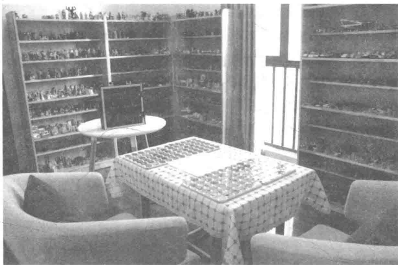
咨询室中的动力棋