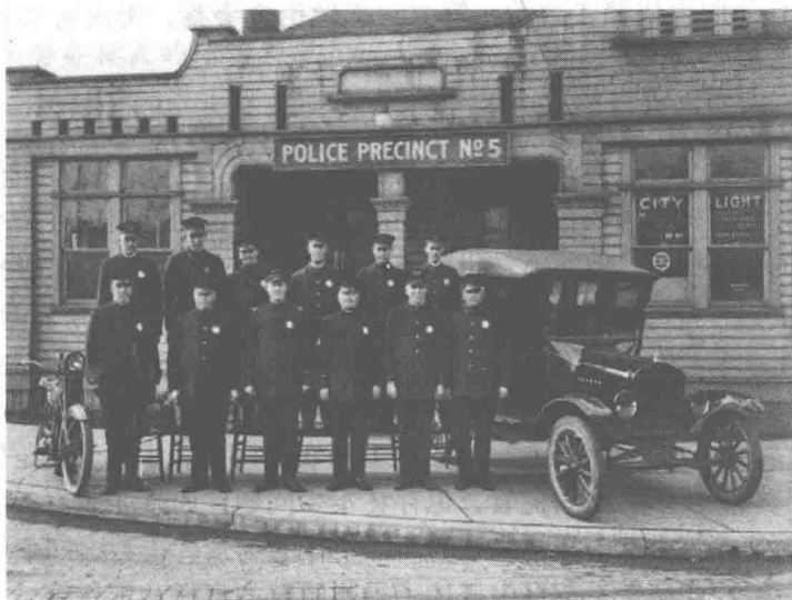
图 1-2 1902 年的巴尔地摩警察局