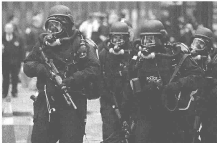
图 1-4 警察职业化的现象——全副武装的警察

1930年至1970年是美国警察的职业化时代，警察侧重于打击犯罪分子和势力，他们从自身的职业中不断获得职业荣誉感。公民呼吁警务改革，要求警察队伍脱离政治的控制，而且警察机构也在努力寻找自身定位和塑造警察的职业形象，他们相当重视专业精神。比如，警察局开始研究笔迹分析，采用摩托车巡逻，探索指纹识别技术等。当时，警察沃尔默撰写的《沃尔默报告》很有影响力。沃尔默是警察局招募到的第一个大学毕业生，还在加州大学伯克利分校讲授警察课程，沃尔默所倡导的警务制度改革在相当一段时期内影响了很多人，他提倡进行警察招聘制度改革并呼吁执法体系脱离政治系统。他的追随者威尔逊是美国警察历史上第一个获得加州大学博士学位的人。威尔逊延续了沃尔默的思想，继续实施和倡导警察职业化和专业化的招聘体系，并进行脱离政治控制的改革。