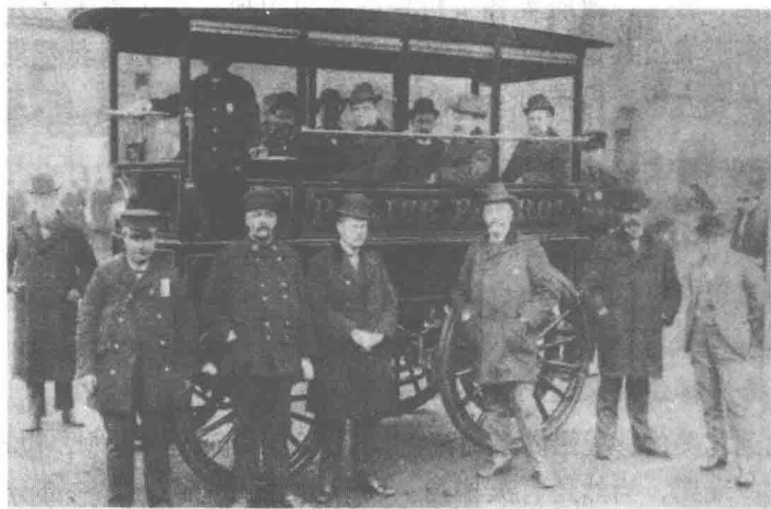
图 1-1 美国第一辆警察巡逻车

教会的人们会在公共场所对犯人用木棍、树枝等刑具进行鞭打，甚至公开实施绞刑，常常会有上百人围观这些严酷的刑罚，目的是让每一个人深深地记住犯罪带来的严重后果。