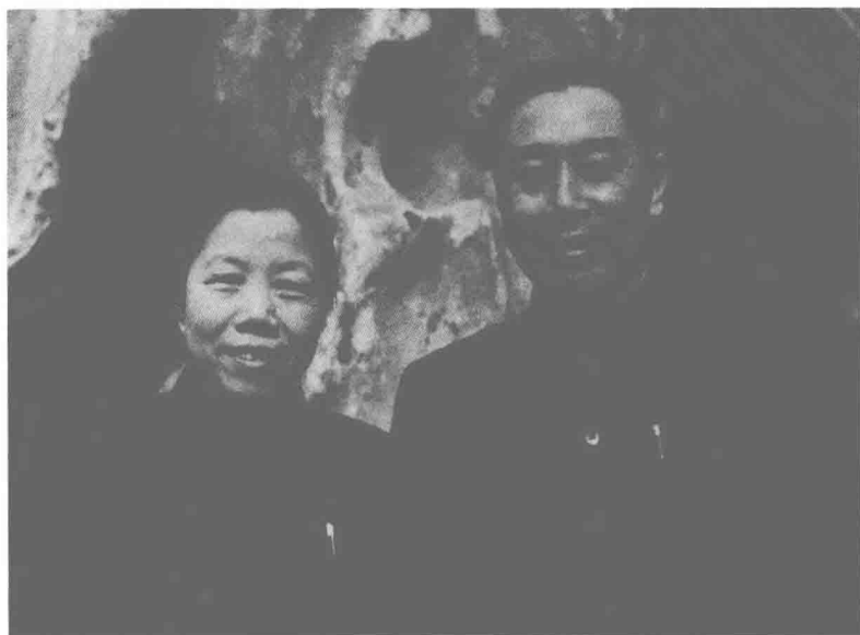
△ 1949年10月，伯父和伯母在颐和园