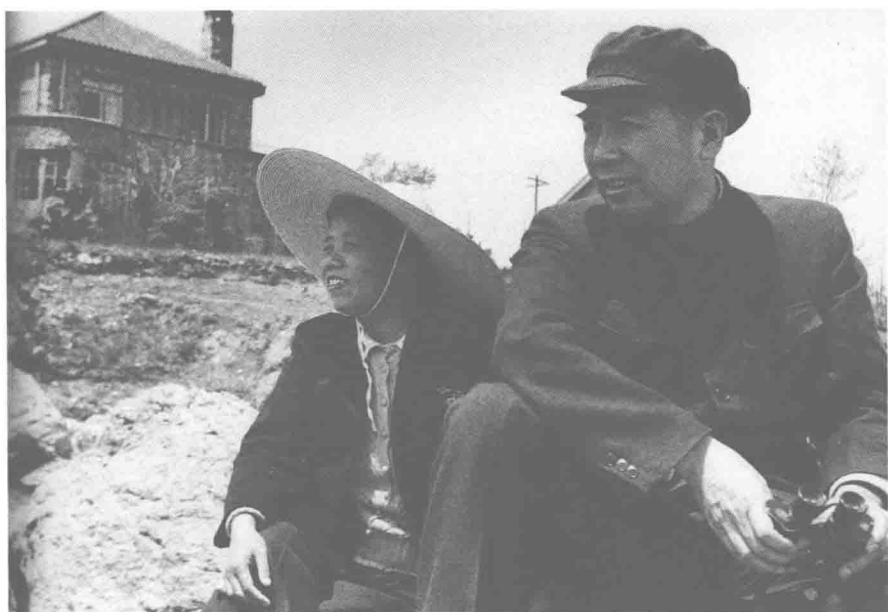
△ 1951年5月，伯父和伯母在大连黑石礁