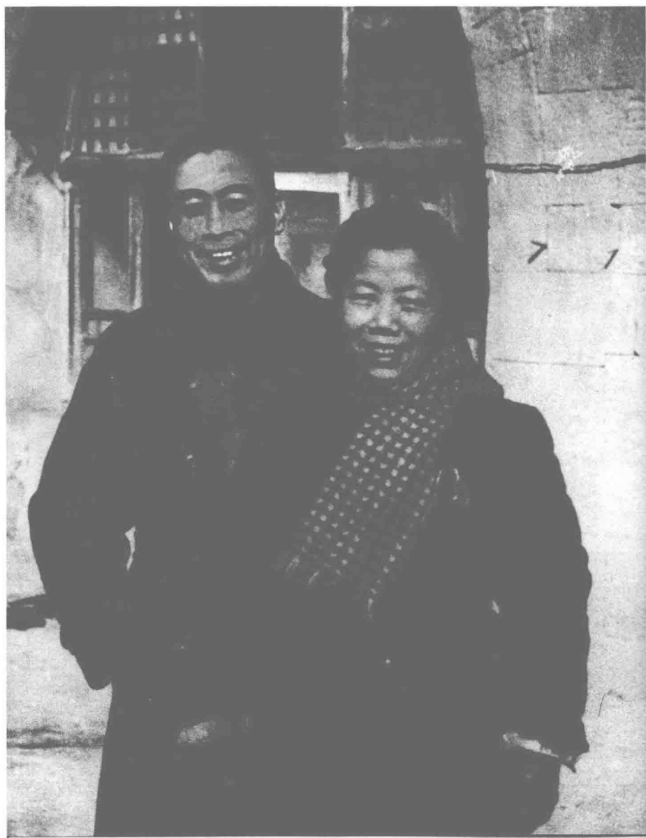
△ 1947年春，伯父留在陕北协助毛泽东指挥全国各战场的人民解放战争。时任中央后委委员、中央妇委副书记伯母随后委转移，先后参加阜平县农村的土改工作和全国土地会议，夫妻二人分别一年有余。这是他们分别前在延安的合影