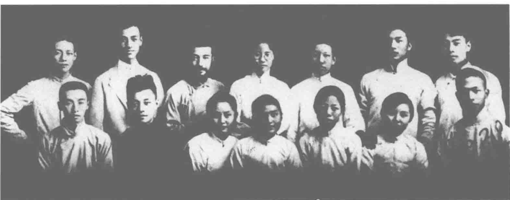
△ 1920年，觉悟社部分成员合影。后排右一为伯父，前排右三为伯母