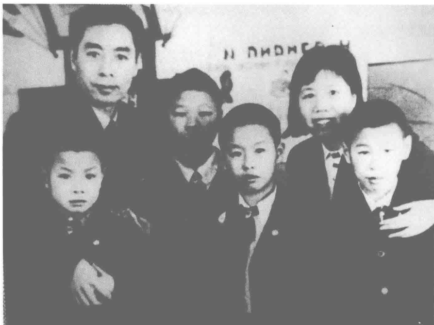
△ 1939年在苏联期间，伯父和伯母看望在莫斯科学习的烈士遗孤