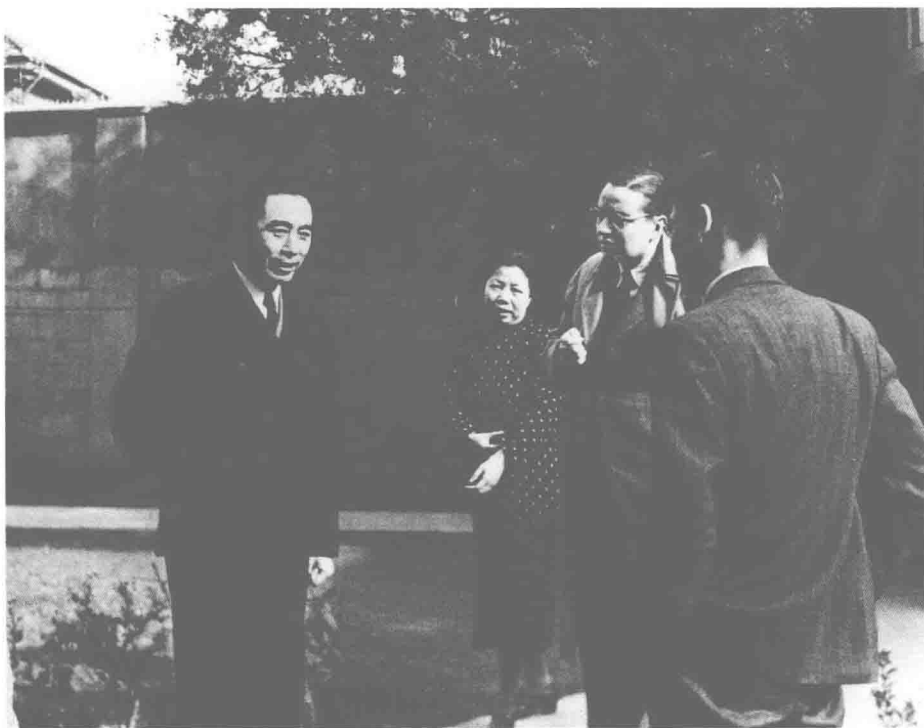
△ 1946年5月，伯父在梅园新村30号院内与国际友人交谈，伯母陪同