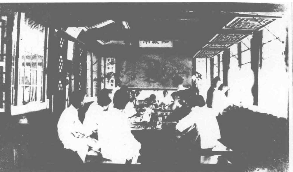
△ 1920年8月16日，觉悟社在北京陶然亭召开茶话会，邀请北京少年中国学会等四个团体的代表共20多人，商讨今后救国运动的方向问题。照片近镜头处为伯父，对面女代表为伯母