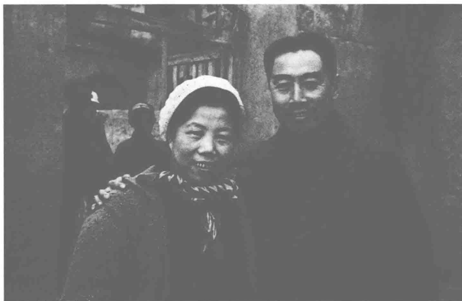
△ 1947年，伯父和伯母在延安王家坪