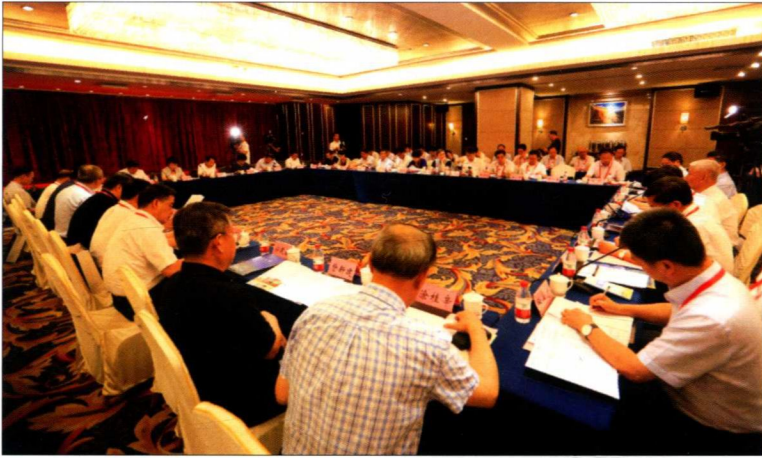
2016年6月17日，中宣部、教育部在郑州大学召开共建新闻学院工作推进会