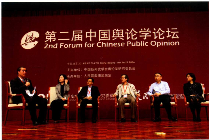
2016年3月26—27日，由中国新闻史学会舆论学研究委员会主办、人民网舆情监测室承办的第二届中国舆论学论坛在人民日报社召开