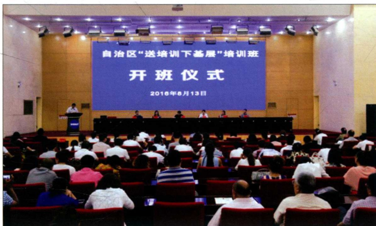
2016年8月13—14日，新疆维吾尔自治区党委宣传部和新疆大学部校共建项目之一“送培训下基层”活动在喀什市举行