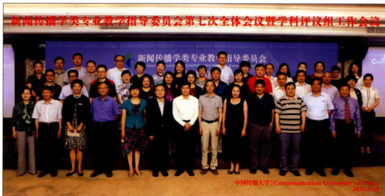
2016年6月18日，新闻传播学类专业教学指导委员会第七次全体会议暨学科评议组工作会议在中国传媒大学举行