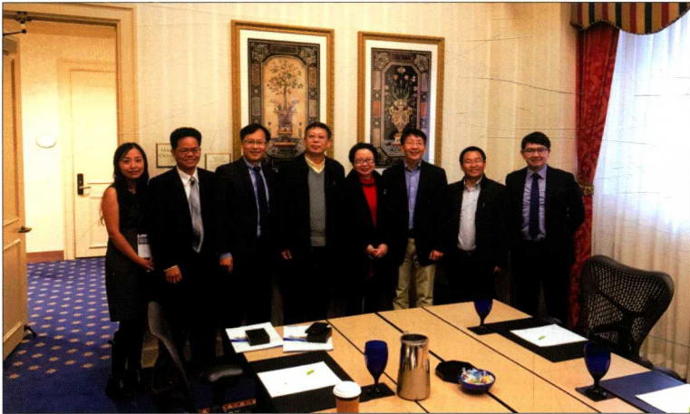
2016年11月，华中科技大学新闻学院与国际中华传播学会在美国费城签订战略合作协议