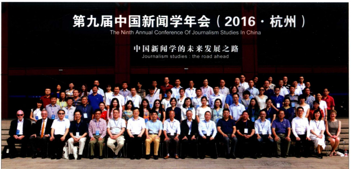
2016年9月24—25日，第九届中国新闻学年会暨“中国新闻学的未来发展之路”研讨会在浙江传媒学院举行