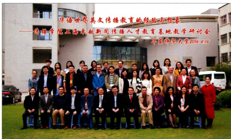
2016年4月，上海卓越新闻传播人才教育基地教学研讨会在华东师范大学召开