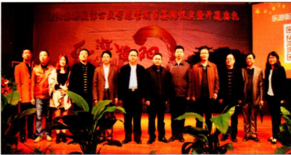
2016年11月，衡阳师范学院与衡阳市旅游外侨民宗局签订合作协议，由新闻与传播学院全面负责该局官方微信公众号“乐游衡阳”的内容生产与运营，以推动衡阳旅游资源与形象的宣传