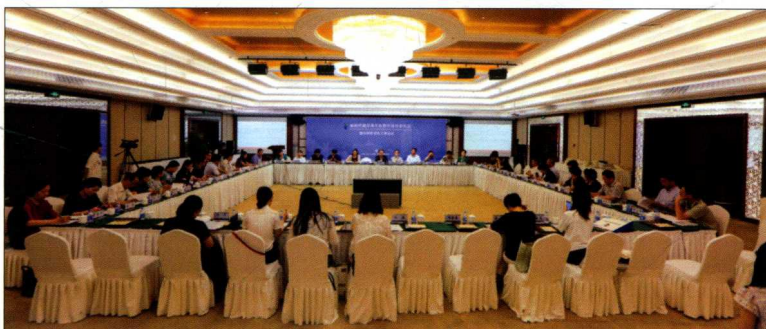
2016年6月18日，新闻传播学类专业教学指导委员会第七次全体会议暨学科评议组工作会议在中国传媒大学举行，图为会议会场