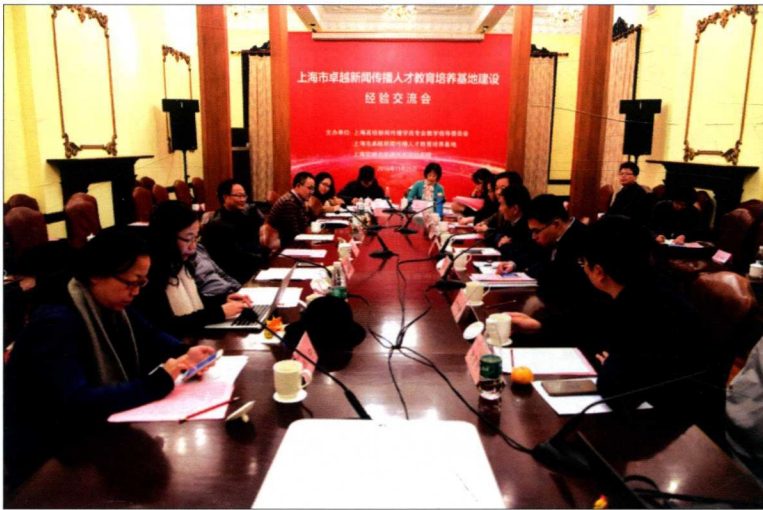
2016年11月25日，上海市卓越新闻传播人才教育培养基地建设经验交流会在上海交通大学召开