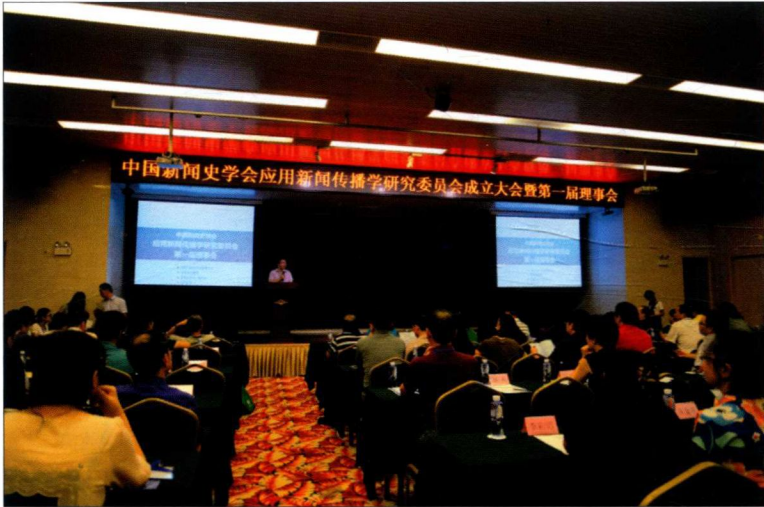
2016年8月28日，中国新闻史学会应用新闻传播学研究会成立大会在中山大学传播与设计学院举行