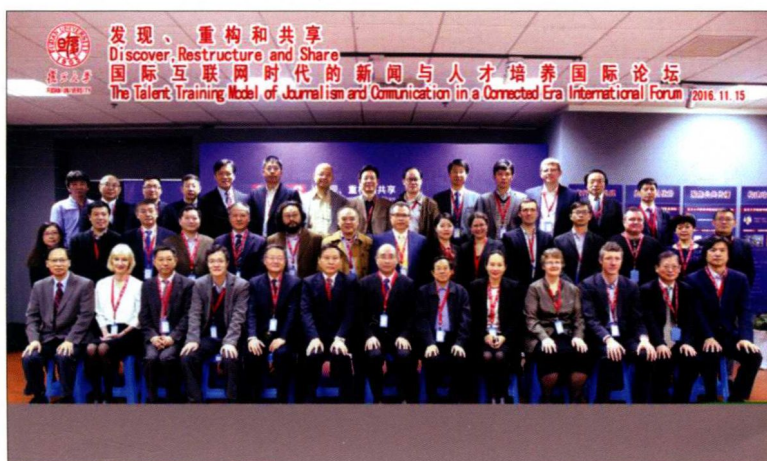
2016年11月15日，“发现、重构和共享：国际互联网时代的新闻与人才培养国际论坛”在复旦大学举行，来自海内外的30多位院长参加了会议