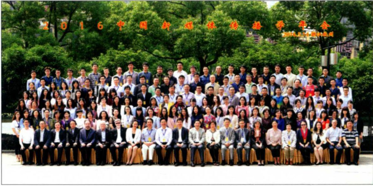
2016年5月，新媒体传播学年会在浙江大学举办，图为会议合影