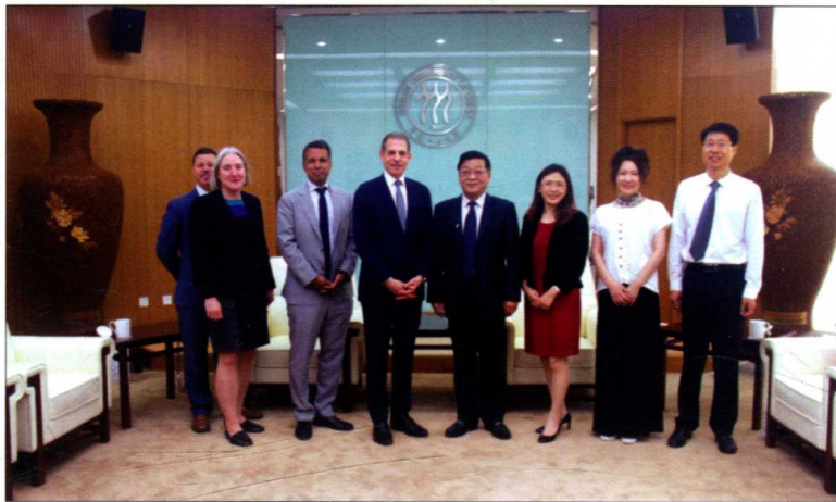
2016年6月8日，美国国务院主管公共外交与公共事务的次国务卿理查德·斯坦格尔（Richard Stengel）率团访问中国人民大学新闻学院，并就中美人文交流新趋势与媒体角色话题与学院师生座谈