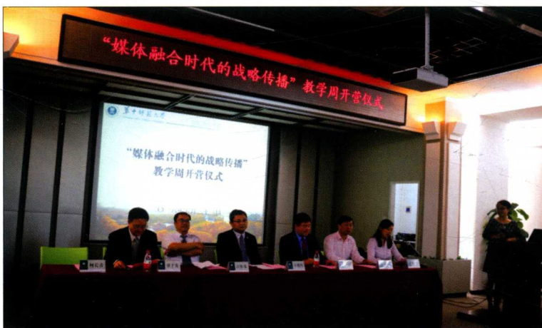
2016年5月，华中师范大学“媒体融合时代的战略传播”教学周正式开营