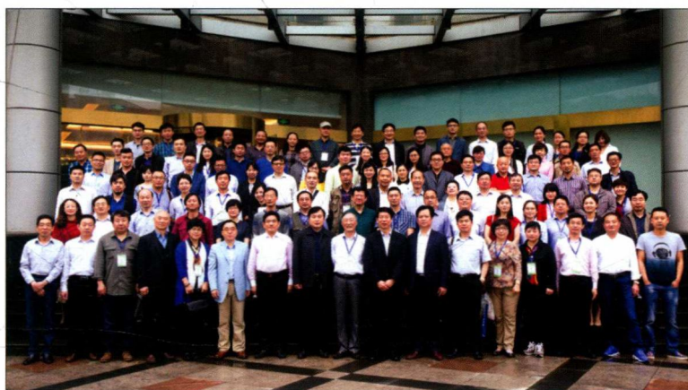
2016年5月28—29日，“全媒体时代新闻传播教育教学创新高峰论坛”在南京晓庄学院举行