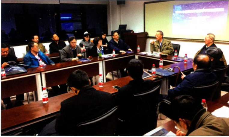
2016年10月，中国新闻学传播学学科发展论坛在兰州大学举行