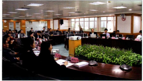
2016年11月10日，湖北大学新闻传播学院与深圳市委宣传部联合召开“深圳市媒体报道传播效力评估”研讨会