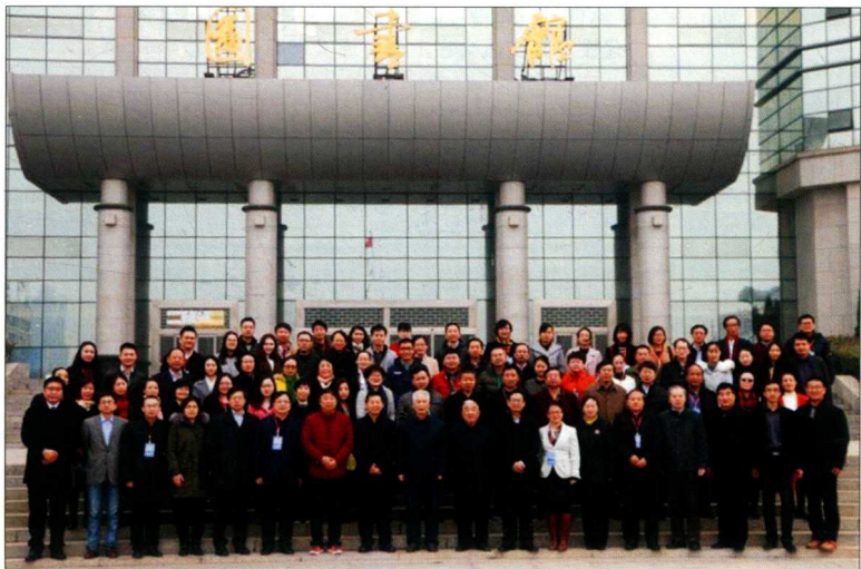
2016年12月3日，中国新闻史学会编辑出版研究委员会成立大会暨河南大学编辑出版教育30年高层论坛在河南大学举行