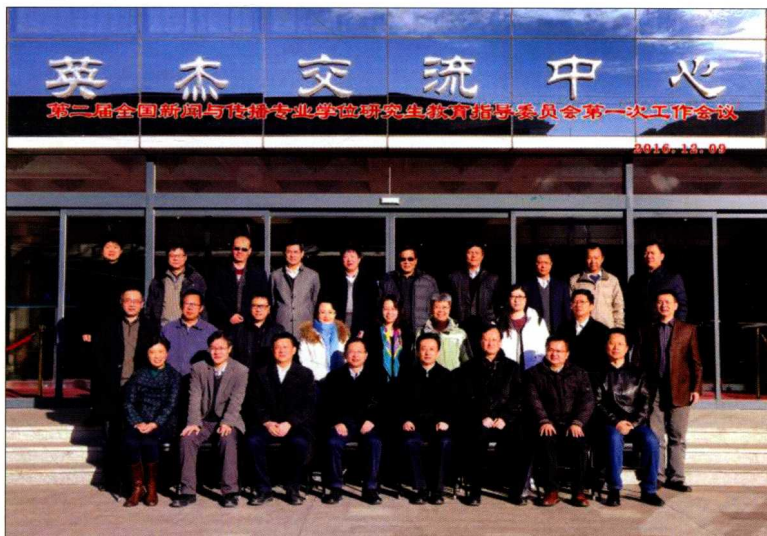
2016年12月，第二届全国新闻与传播专业学位研究生教育指导委员会第一次工作会议在北京大学召开