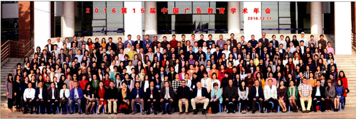
2016年12月，第15届中国广告教育学术年会在华南理工大学召开，会议以“使命与责任：中国广告的创新与未来”为主题