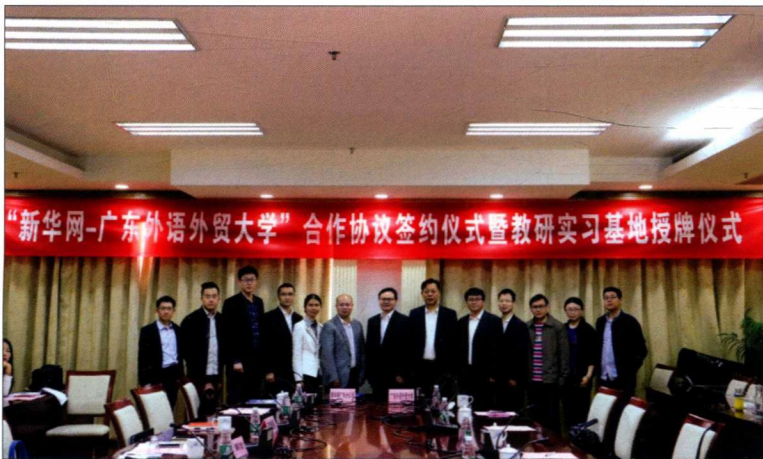
2016年3月31日，共建合作平台，促进媒体创新——“新华网—广外”合作协议签约仪式暨教研实习基地授牌仪式现场