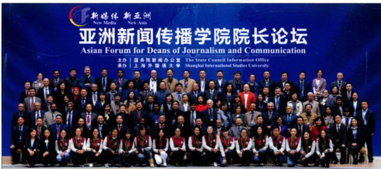
2016年11月30日—12月1日，“亚洲新闻传播学院院长论坛”在上海举办。此次论坛由国务院新闻办公室主办、上海外国语大学新闻传播学院承办，来自亚洲22个国家和地区的近百位新闻传播学界专家学者共襄盛会