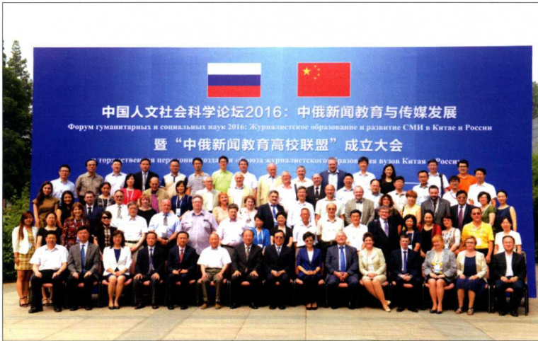
2016年7月9日，“中国人文社会科学论坛2016：中俄新闻教育与传媒发展”暨“中俄新闻教育高校联盟”成立大会在中国人民大学国学馆举行