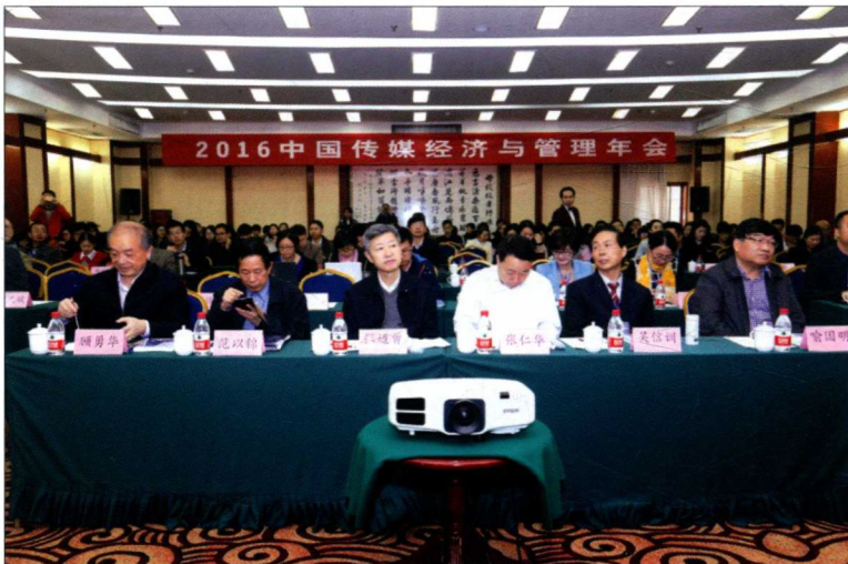
2016年11月5日，“2016中国传媒经济与管理年会——舆论新格局·传媒新常态”学术研讨会在西安交通大学举行