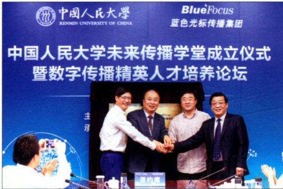
2016年7月21日，中国人民大学“未来传播学堂”成立仪式暨“数字传播精英人才培养论坛”在北京举行