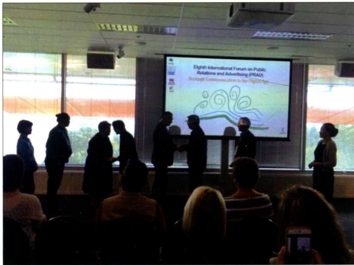
2016年1月，由华中科技大学与中国新闻史学会公共关系史研究委员会举办的第八届公关与广告国际学术论坛在新西兰举行，图为会议开幕式上当地毛利人为会议代表举行的碰鼻礼