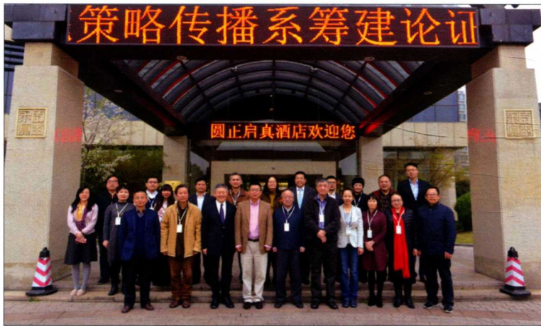
2016年3月19日，浙江大学传媒与国际文化学院策略传播系筹建论证会在杭州召开