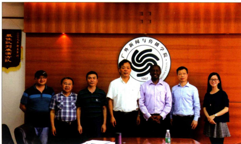
2016年4月25日，来自俄亥俄大学的Yusuf Kalyango教授以“和平新闻学与危机传播管理”为主题，与广东外语外贸大学的同学们分享了他在专业领域的见解与看法