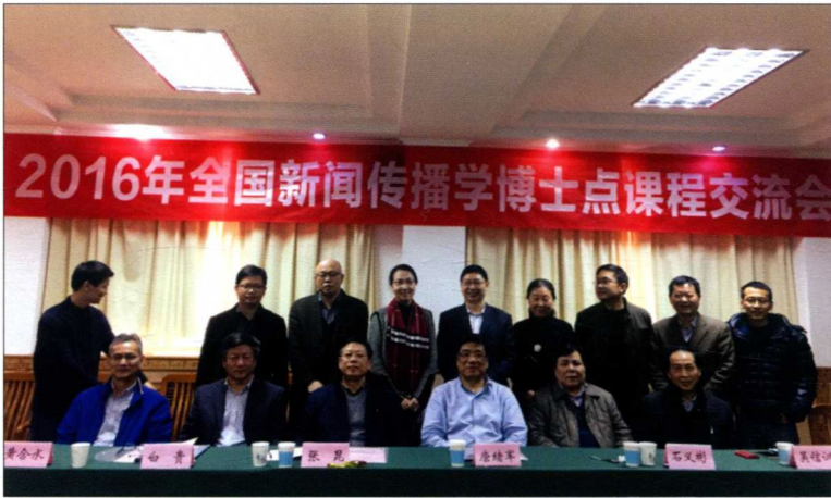
2016年12月9日，国务院新闻传播学科评议组在华中科技大学举行全国新闻传播学博士点课程交流会，图为会议部分代表合影