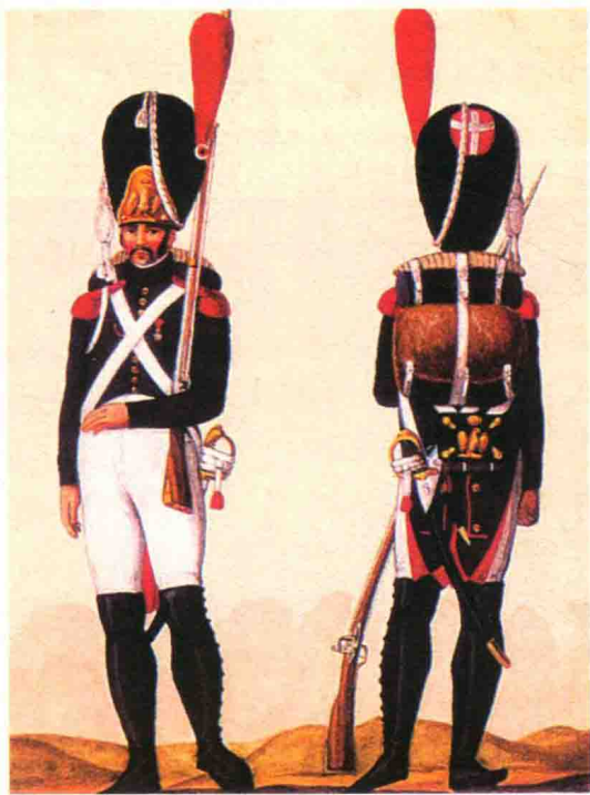
▲ 1807年法国近卫军射手的服饰