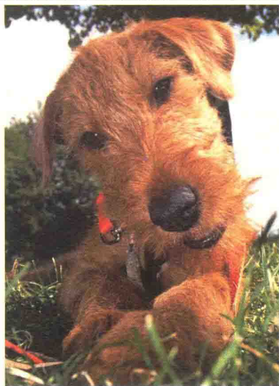
憨态可掬的爱尔兰梗犬

狗通常被称为“人类最忠诚的朋友”，今天，家犬的种类已经高达数百种，其中有普通的，也有名贵的。世界上排名前十的名犬有：猛犬霸王中国藏獒、俄罗斯高加索、意大利扭玻利顿、巴西非勒、法国波尔多、阿根廷杜高、阿根廷獒、中亚牧羊犬、西班牙加纳利犬、怪异杀手牛头梗、无声斗犬扶桑土佐。