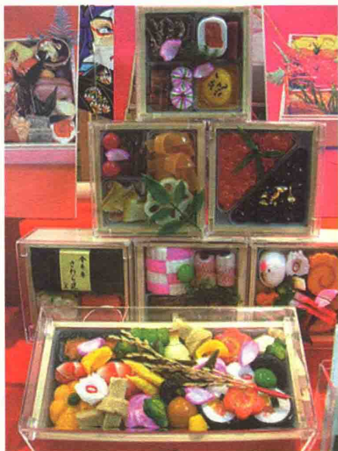
日本人在“正日”这一天，早餐很丰盛，吃砂糖芋芳、荞麦面等，喝屠苏酒。此后一连三天，则吃素食，以示虔诚，祈求来年大吉大利。

城乡各地张灯结彩，许多单位都挂上“庆祝元旦”的巨幅标语。人们或走亲访友，或外出游玩，以不同的方式表达对节日的祝贺。除此之外，电视台也会转播元旦欢庆节目，将节日的喜庆气氛传到全国各个角落。