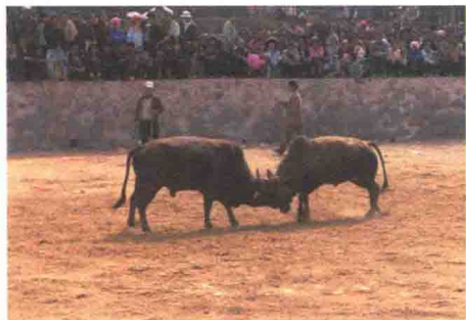
花山节时，苗族人兴致高昂地举行斗牛比赛。

花山节起源于一个美丽的传说。相传在很久以前有个叫憨哥的青年，以打猎和种地为生，爱好吹芦笙，并与住在桃花寨的桃花姑娘彼此相爱。但是，远方有一个有钱有势的恶霸因覬覦貌美的桃花姑娘而把她抢走了。为了救回心爱的姑娘，憨哥拿上弓箭和桃花姑娘给他缝制的百羽衣，趁过年逛街的时候把恶霸杀死。回到桃花寨后，乡亲们高兴地围着憨哥和桃花姑娘跳舞，以示庆贺。天黑后，他们告别乡亲，一起奔向远方，再也没有回来。从此以后，人们都会聚集到憨哥与桃花姑娘离别的地方，跳舞、吹芦笙、射箭、