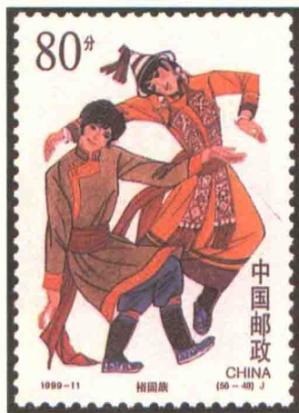
我国发行的裕固族主题邮票

“花儿”又称“少年”，这种歌曲的主要内容是用来表达男女之间的爱慕之情，青年男女用歌声为媒，向对方表达爱慕。但是在