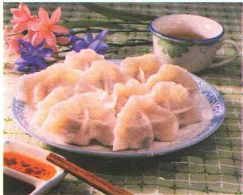
饺子，除夕之夜北方人包饺子，南方人做年糕。水饺形似“元宝”，年糕音似“年高”，都是吉祥如意的好兆头。

除夕之夜吃年夜饭是千百年来不变的习俗，是家家户户一年中最热闹的时候。它的意义非同寻常，一顿饭，补偿了人们一年的辛苦，也实现了人们一年的企盼。习惯上，