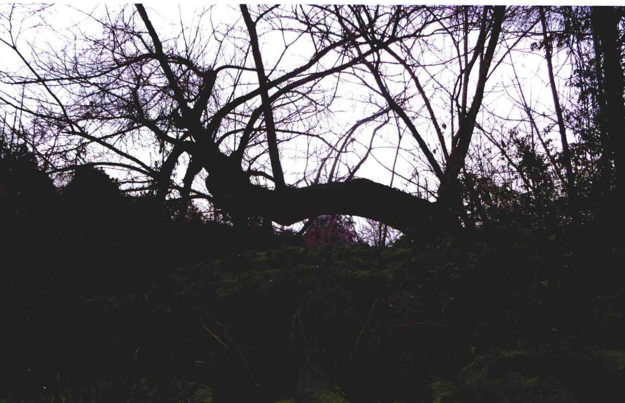
象山精舍遗址水井