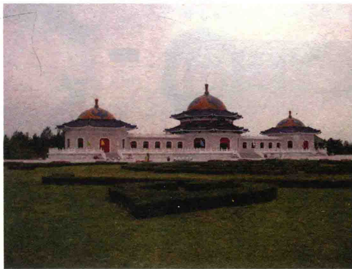
▲ 内蒙古鄂尔多斯成吉思汗陵墓

但是，对战争和征服的痴迷也是成吉思汗的最大污点。他有一句名言：“人生最大的快乐莫过于到处追杀你的敌人，侵占他们的土地，掠夺他们的财富，然后听他们妻子儿女的痛哭声。”这种野蛮的思想使成吉思汗的双手沾满了鲜血，也为欧亚大陆的人民带来了深重的灾难，为蒙古帝国日