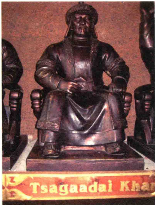
▲ 蒙古国嘎丘尔特察合台铜像