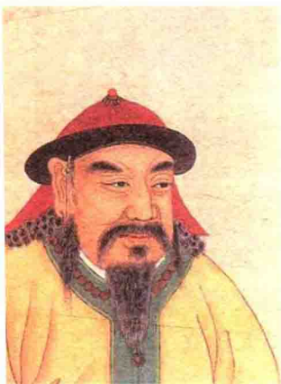
▲ 也速该（1134~1179）， 蒙古乞颜部首领

都说虎父无犬子，铁木真的父亲也速该原本是蒙古乞颜部落的头领，1161年他在斡难河（也称鄂伦河鄂诺河或敖嫩河。古称黑水，为黑龙江上游之一，发源于蒙古小肯特山东麓）边打猎时，遇到了蔑儿乞部赤列都与弘吉剌部河额仑结亲的队伍，在当时“抢亲”是和一种传统，他打败了蔑儿乞人，