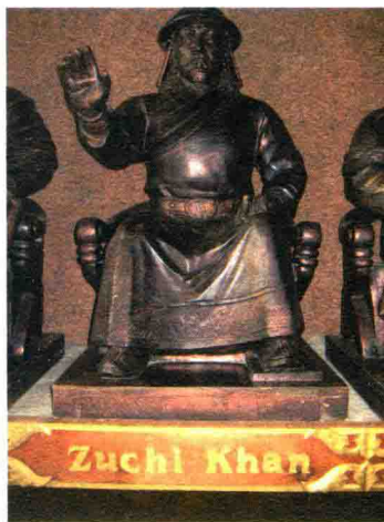
▲ 蒙古国嘎丘尔特术赤铜像