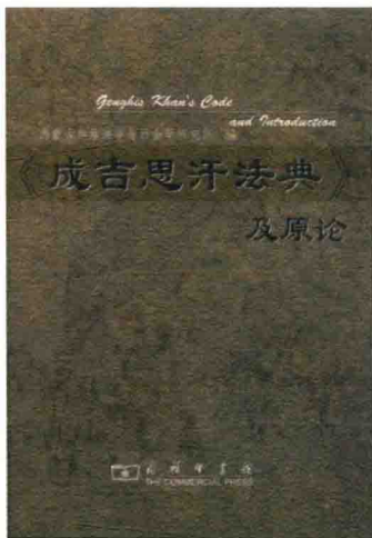
▲ 《成吉思汗法典》封面

1201年，泰赤乌部、塔塔尔部、蔑儿乞部、扎答阑部等十二部共同推举札木合为“古尔汗”，此时的铁木真早已成为札木合眼中钉，率军攻打铁木真。铁木真遂联合王罕，在阔亦田（今贝尔湖哈拉河上源处）之战中击败敌军。第二年，铁木真追击并屠灭了塔塔尔部，他根据父亲的临终遗言，将所有身高超过车轮的塔塔尔男子统统杀光。这一做法轰动了当时的各个部落。他与王罕之间也逐渐产生了嫌隙，最终演变到兵戎相见。1203年春，王罕之子桑昆率领部众突然袭击了铁木真，混战中大将博尔术和铁木真第三子窝阔台均中箭受伤，铁木真最困窘之时身边只剩下了19名士兵。不服输的他在秋天，卷土重来，乘王罕举办宴会之时包围了对方的营帐，展开了连续三昼夜的激战。王罕突围逃走后进进入乃蛮部地界，被哨望的士兵杀死，其子桑昆也客死异乡，铁木真一举消灭了克烈部。蒙古诸部逐步成为铁木真的势力范围，只剩下西方的乃蛮部不在其掌握之中，以札木合为首的敌人们也都汇聚到了乃蛮部太阳汗的旗帜下，欲与铁木真做最后的抗争。1204年，铁木真于纳忽崖之战击败了乃蛮大军，太阳汗被杀，其子屈出律逃亡西辽，札木合则被俘