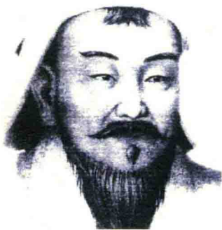
▲ 札木合（? ~1204）， 蒙古札达阑部首领

部众离开，回到了本族原来的领地生活。他在那里被推举为乞颜部的可汗。1190年，札木合借口自己的族人被铁木真的部下所杀，联合了泰赤乌等十三部族向铁木真开战。铁木真也把自己的部众分为十三翼，自己和母亲各率领一翼，另外十二翼则交于其他贵族，双方会战于答阑版朱思（今蒙古温都尔罕西北）。实力薄弱的铁木真被札木合打败，率众败退到斡难河上游的狭长地带拒守，札木合遂撤兵回师。但是札木合在这场战争中所表现出的残暴不仁却令他失去了民心，许多部众纷纷投奔铁木真，使其实力得到迅速恢复并壮大。