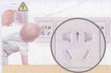
图 1-5 带拨片的儿童安全插座

比如家里有没有小孩？小孩多大？然后根据这个确定栏杆高度和间隔；插座是否需要用带拨片的安全插座（见图 1-5）？再比如喜欢吃火锅吗？餐桌底下要不要装一个地插？老人行动方便吗？老人房厕所要不要装一个手扶把手（见图 1-6）？你选的主材搭配协调吗？你选的家具适合你的装修风格吗？