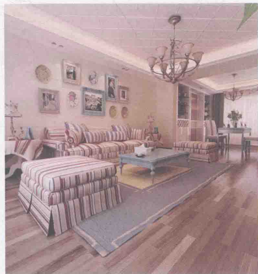
图 1-4 清新田园风格