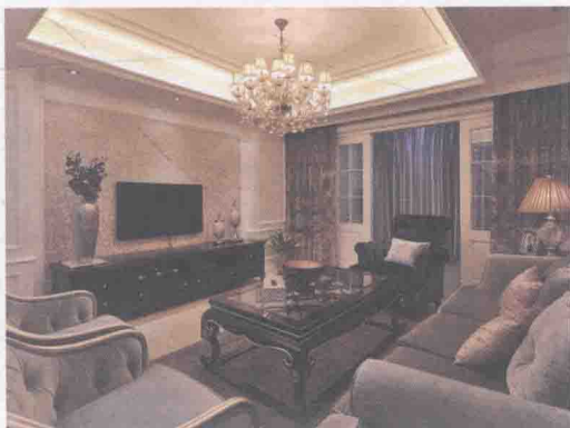
图 1-2 新古典主义风格