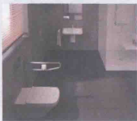
图 1-6 马桶旁边安装把手

这些问题根据每个人的需求有各种不同的要求，总之一一个原则，就是要舒服好用。但是怎么让自己舒服好用，只有自己最清楚，所以，尽可能参与设计吧。问问自己想要什么？把自己想要的都列出来，然后告诉设计师并和他讨论确定。