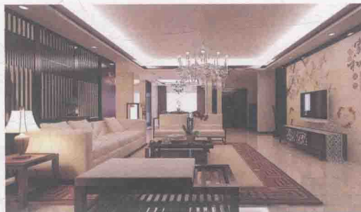
图 1-3 新中式风格