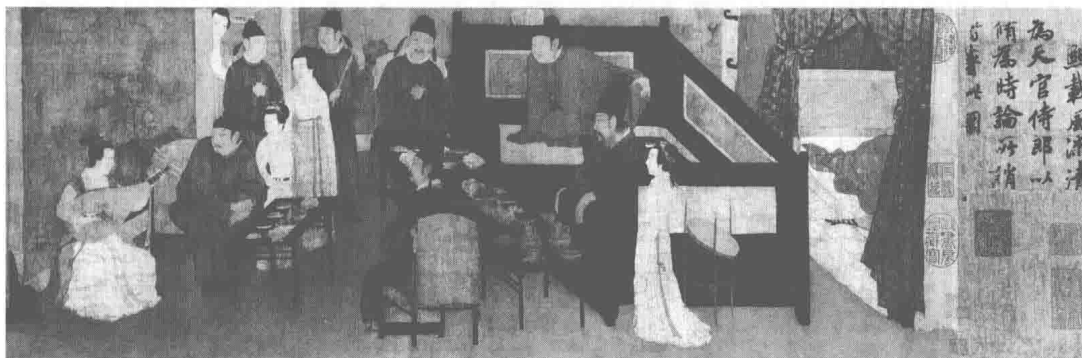
图 1-2 可移动文物:《韩熙载夜宴图》

图 1-1 不可移动文物:河南洛阳的龙门石窟中的奉先寺。龙门石窟与甘肃敦煌的莫高窟、山西大同的云冈石窟并称为“中国三大石刻艺术宝库”,展现了北魏晚期至唐代的造型艺术。其中奉先寺是龙门石窟中最大的一个窟,艺术也最为精湛,代表了唐代石刻艺术的成就。2000 年“龙门石窟”被联合国教科文组织列为世界文化遗产。