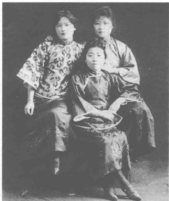
■ 宋耀如的三个爱女：宋霭龄（中）；宋庆龄（左）；宋美龄（右）

沿着龙脉往东北，绵亘20余里的笔架岭出现了。笔架岭海拔63米，自得一番独特的风景；陆地至海洋的将尽未尽处，也耸立起一座山岭，叫做铜鼓岭。铜鼓岭被誉为“天下奇峰翠此中”。笔架岭、铜鼓岭的位置、状貌等流露出龙气聚钟与龙脉尽结的信息。