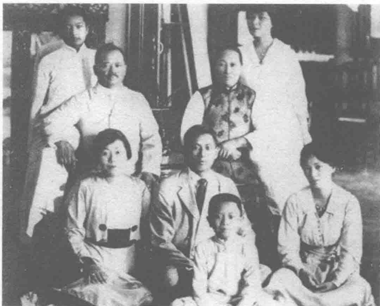
■ 宋家全家福：右起为宋庆龄、宋子安、宋子文、宋霭龄；后排：宋美龄、倪桂珍、宋耀如、宋子良

奠定这个家族基础的人叫宋耀如，他有六个儿女，其中三个女儿宋霭龄、宋庆龄和宋美龄可称为民国“皇后”；三个儿子宋子文、宋子安、宋子良也都是中国近代史上影响深远的显赫人物。