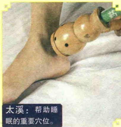
太溪：帮助睡眠的重要穴位。