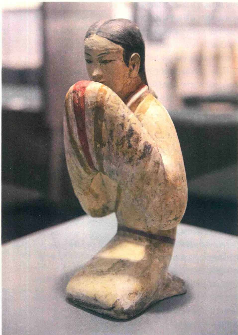
陶彩绘拱手跪坐俑·西汉

◎1995年陕西省西安市阳陵陪葬墓出土。汉阳陵博物馆藏。俑朱唇黑眉，面容清秀，一袭深衣，正是现实生活的写照。这种俑塑绘出女性的美丽、娴静、细腻韵致，足以令人倾倒。