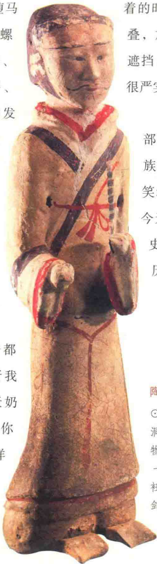
陶彩绘仪卫俑·西汉

在过去，还有相当一部分人认为套裤是农耕民族的专属，甚至还以此嘲笑农耕民族缺乏创造力。在今天看来，这种嘲笑是对历史的不甚了解。我们翻看历史资料可以发现，游牧