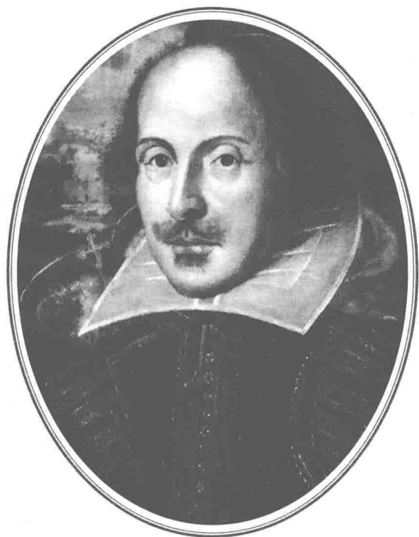
威廉·莎士比亚 William Shakespeare