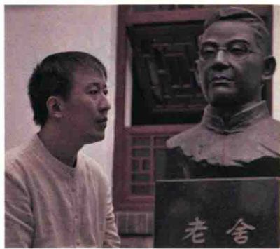
魏新，文化学者，全国青联常委， 央视《百家讲坛》主讲人。