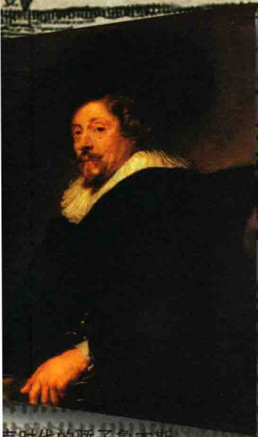
巴洛克时代的骄子鲁本斯

当硝烟随一纸和约的降临世间而散去时， 新旧两个世界已全然不同， 不只催生出了一系列的民族国家， 而且形成了一个国际体系， 从而改变了所有欧洲国家的运行轨道。