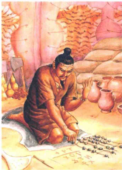
原始文字传播阶段

人类经过了口头传播阶段、文字传播阶段、印刷传播阶段、电子传播阶段和现在网络传播阶段的发展，但最原始的口头传播仍然是生活中不可缺少的传播方式之一。我们日常接待、新闻发布、演讲、沟通性会议、公务谈判和演说等场合均使用口头传播。可以说，在网络传播时代的今天，口头传播仍是应用最广泛的。