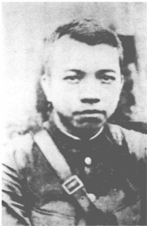
第四军第一任军长李济深