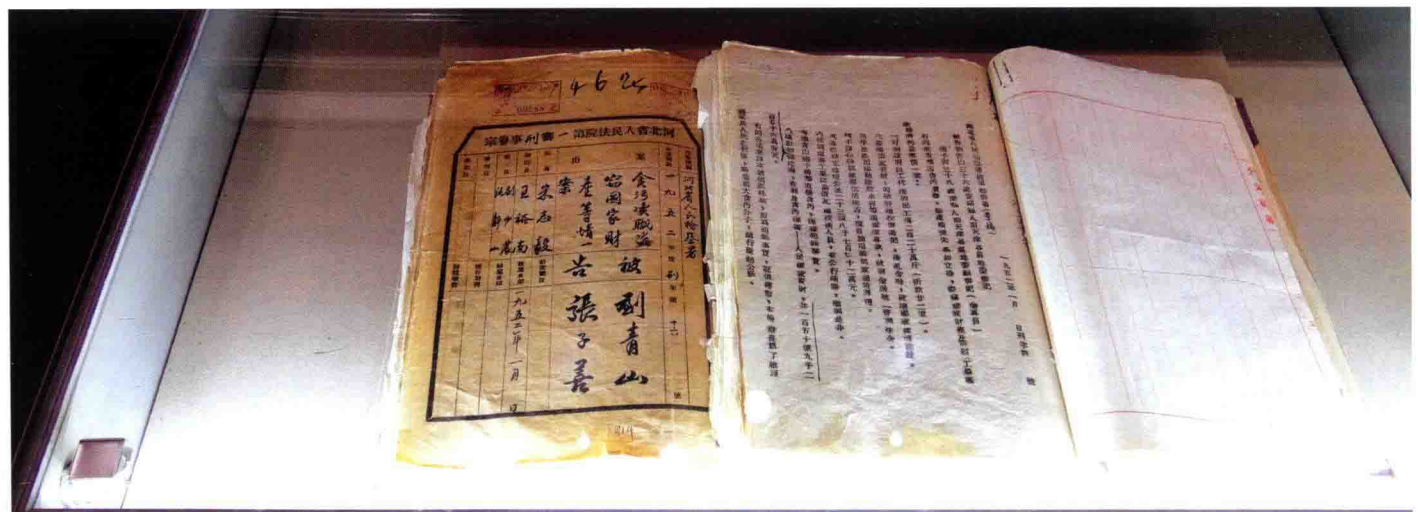
新中国反贪第一大案——刘青山、张子善贪污案