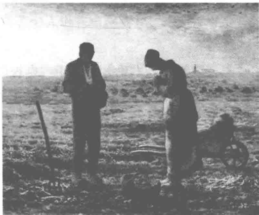
图0-1 让·弗朗索瓦·米勒的作品《晚钟》

对本书写作影响较大的首先是一本关于声音文化研究的著作——法国历史学家阿兰·科尔班的《大地的钟声:19世纪法国乡村的音响状况研究和感官文化》。笔者在十几年前读这本书时,就被作者独特的视角深深吸引了,当时的体会是作者居然能把“钟声”作为研究对象做如此深入细致的社会现象与文化现象研究,令人着迷。这本书通过分析研究19世纪约1万起与“钟”有关的事件后,发现这些不同寻常的事件背后存在着一个社会秩序和权力的体系。“钟”正是这一体系的一个节点,它支配着乡村生活的节奏,确定空间范围,决定集体和个人的身份;它也是农民精神生活的象征性符号,犹如法国巴比松派画家让·弗朗索瓦·米勒的作品《晚钟》中所描绘的那样:一天辛勤的田野劳作在夕阳西下中结束了,一对农民夫妇刚听到远方传来的教堂钟声,于是便自然而然地、习惯地俯首摘帽祷告。钟声是乡村生活中重要的精神意象(图0-1)。因此,《大地的钟声》也成为笔者写作本书时的一盏明灯。