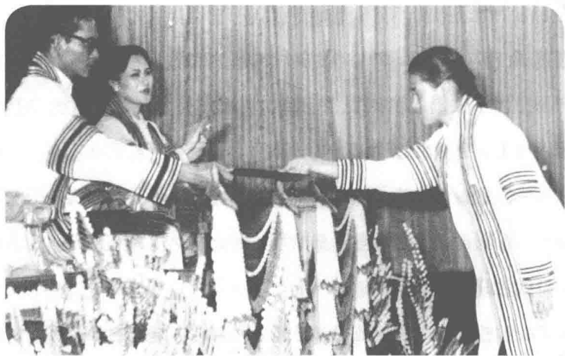
普密蓬国王与王后为诗琳通公主颁发毕业证书