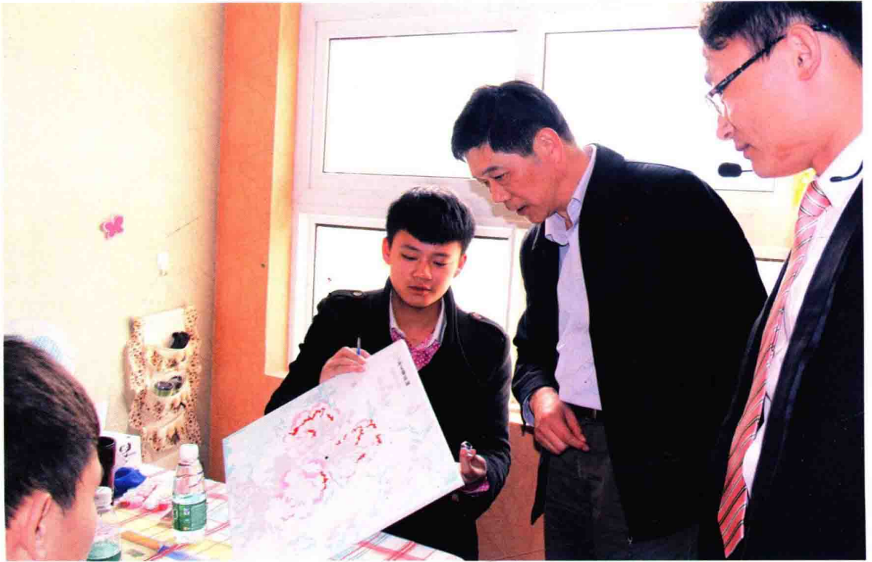
省教育厅副厅长朱卫国考察江苏经贸职业技术学院大学生创业工作推进情况