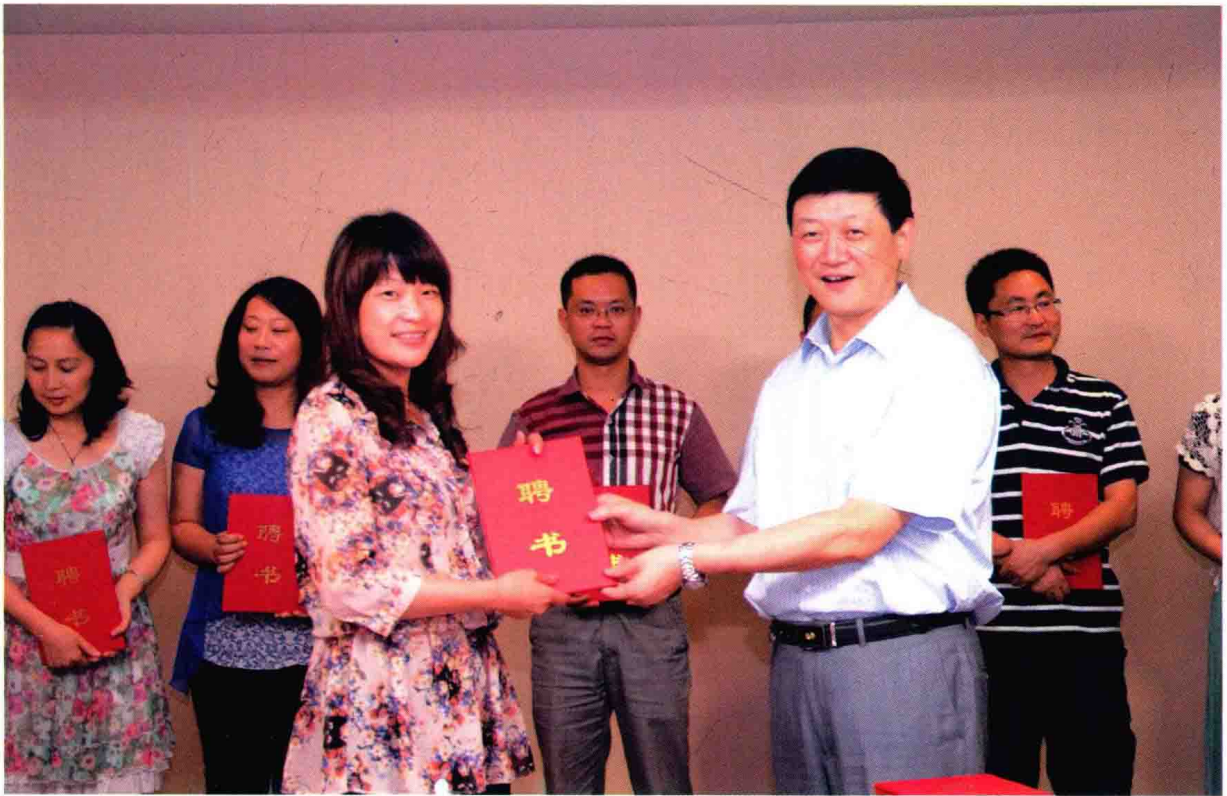
省教育厅副厅长、省委教育工委副书记胡金波向乡镇语言文字规范化视导员颁发聘书