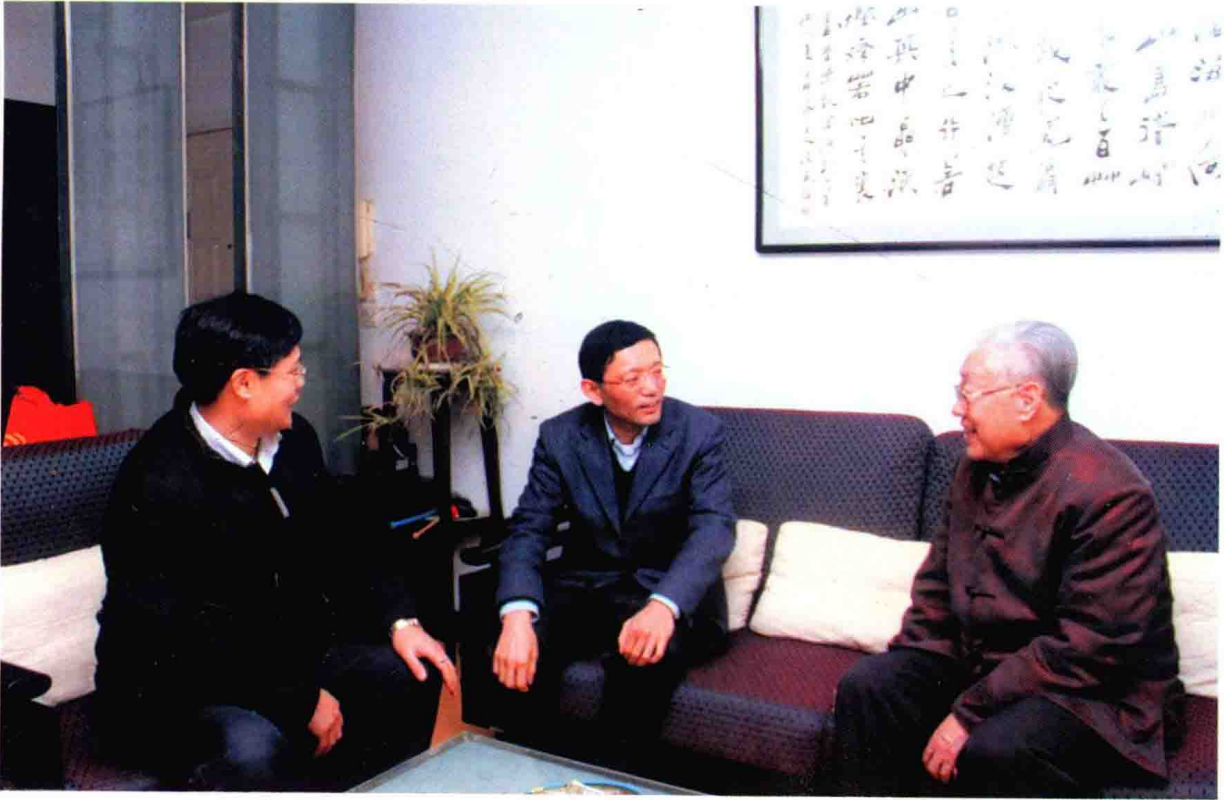
省委教育工委书记潘漫看望退休老同志