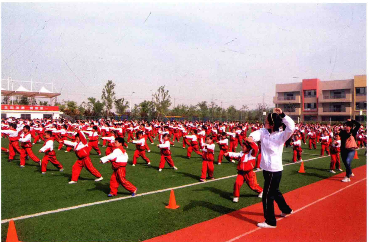
淮安市天津路小学大课间活动