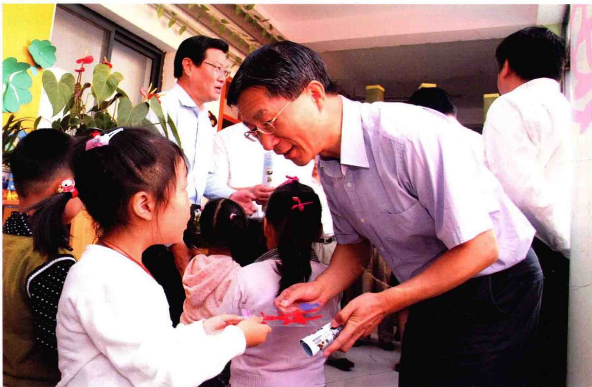
副省长曹卫星考察镇江市学前教育工作