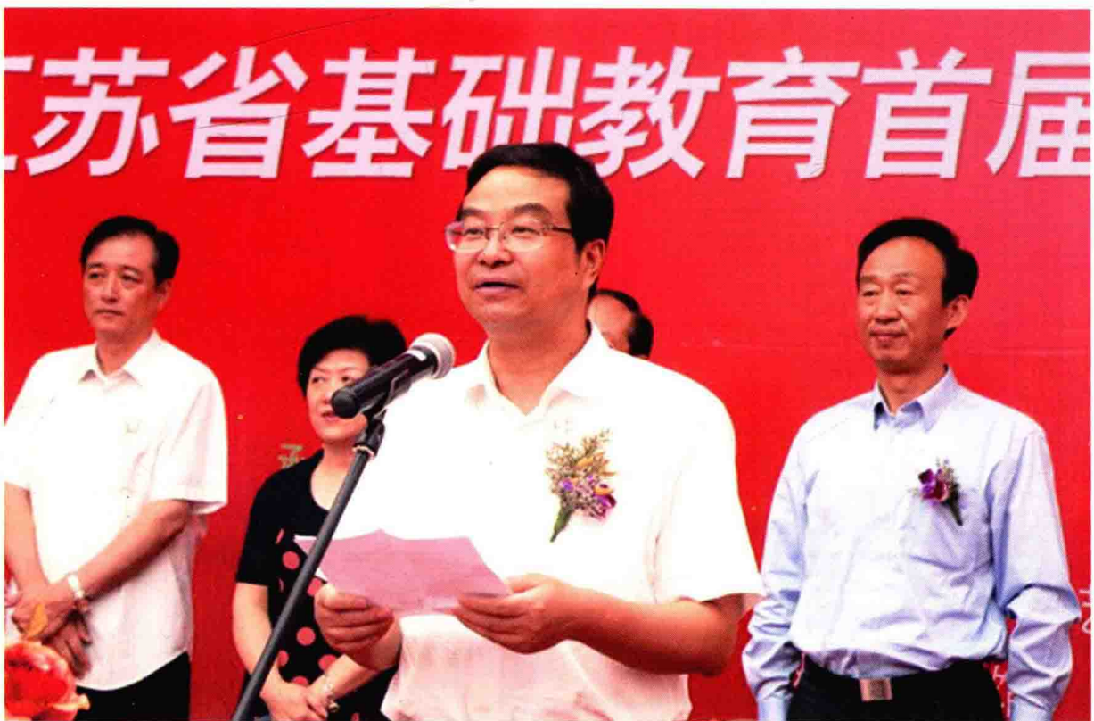
省教育厅副厅长丁晓昌出席江苏省基础教育首届书法篆刻作品展