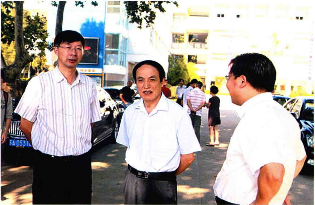
省委教育纪工委书记蒋吉生检查南京市小营小学行风建设情况