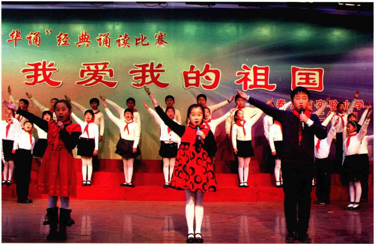
泰州市实验小学经典诵读比赛