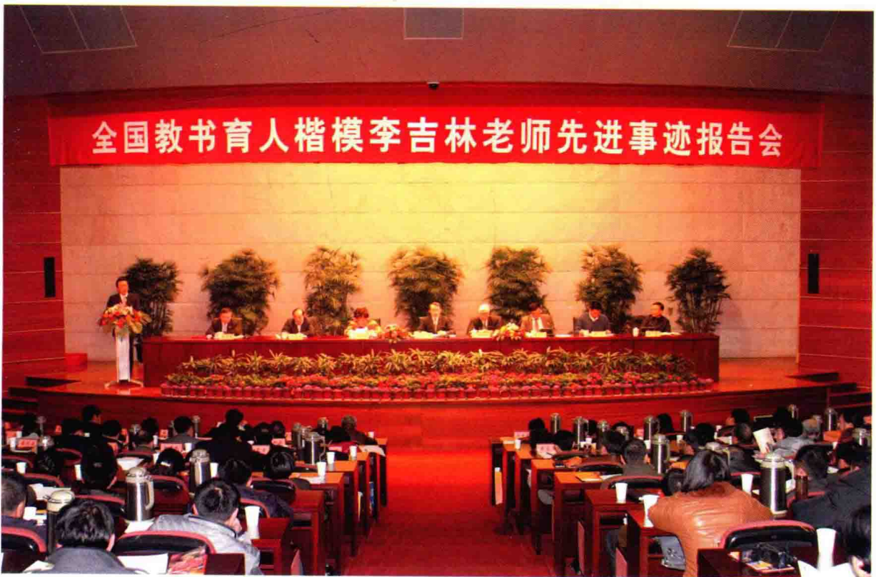
省教育厅举行全国教书育人楷模李吉林老师先进事迹报告会