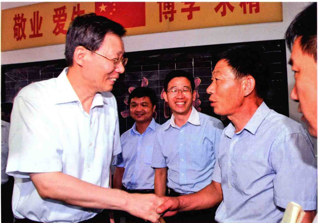
省长李学勇看望丰县乡村教师