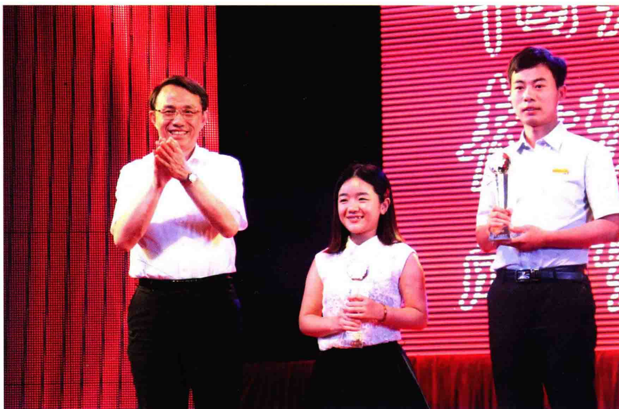
省教育厅厅长、省委教育工委书记沈健出席江苏省大学生年度人物颁奖典礼