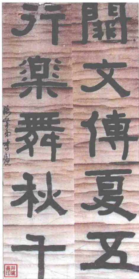
明李开先对联手迹