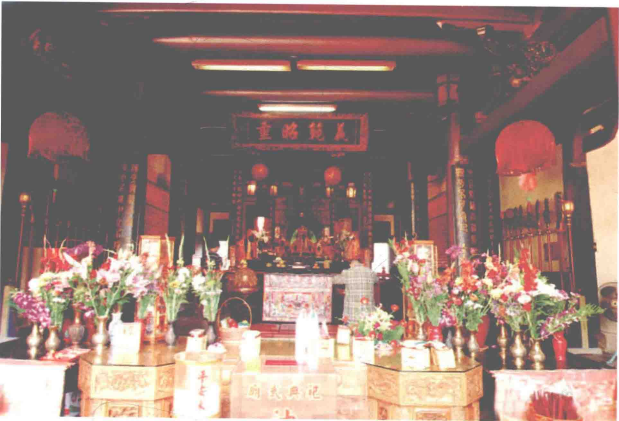
台南大天后宫对联格局