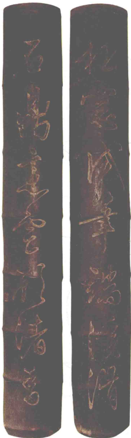
松窗试笔端溪滑，石鼎烹云顾渚香