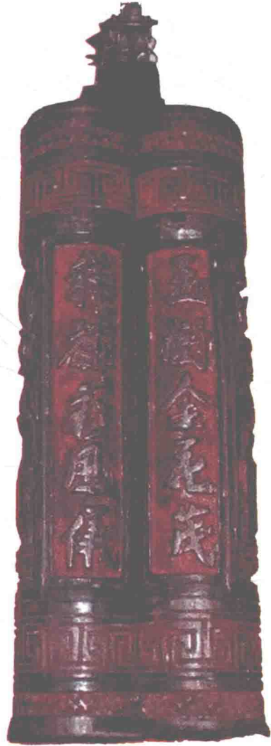
玉树金花茂， 祥麟彩凤仪