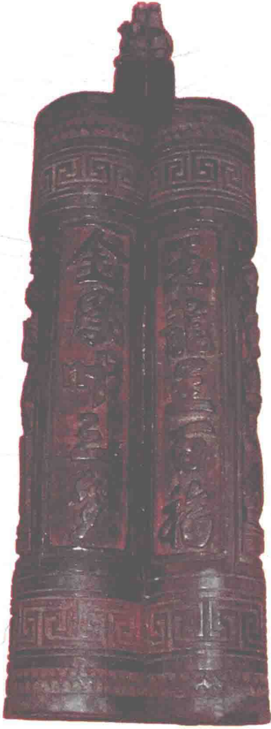
玉龙呈百福， 金凤叶三多