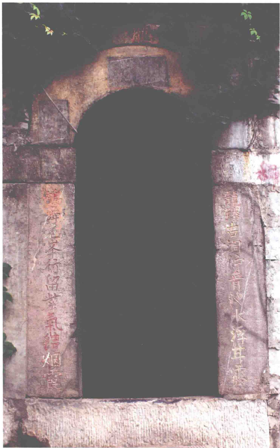
明代鹿泉抱犊寨蛟龙洞对联