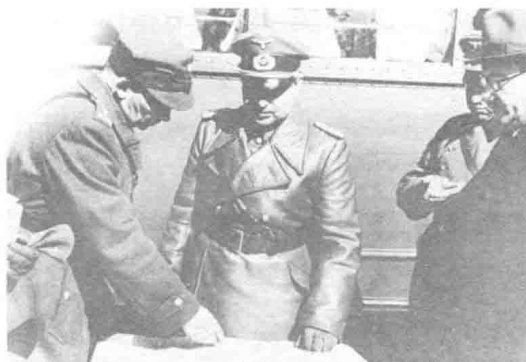
↑ 波兰和德国指挥官在1939年讨论华沙的受降问题。