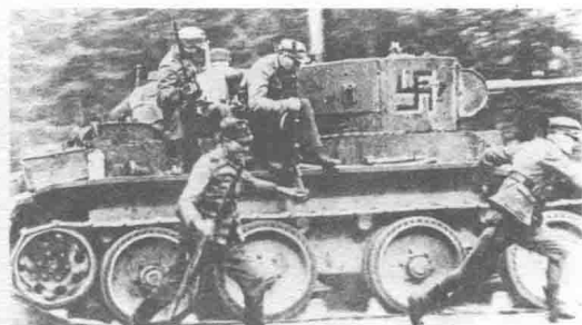
↑ 在1939—1940年的冬季战争中，芬兰部队部署了BT-5轻型坦克来抵御苏军。斯大林对入侵战争的错误指导不仅给苏军带来了45000人的伤亡，而且引起了芬兰人的仇恨，致使在以后的“巴巴罗萨”行动中芬兰与德军并肩作战。