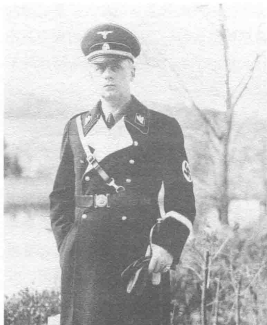
↑希特勒的外交部部长约阿希姆·冯·里宾特洛甫。