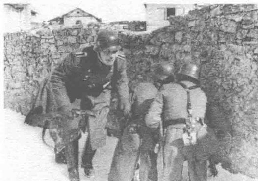
↑ 雨果·施迈塞尔研制的MP28型冲锋枪是MP18型冲锋枪的真正改进型，图中士兵手中所拿的即为MP28型冲锋枪。

苏联后方薄弱的基础设施意味着，德国人要想取得他们以前在闪击战中的速度和冲击力是不可能的，因为苏联的后方几乎没有石子路，尘土很可能给装甲车的发动机带来问题，特别是在夏季；秋季的烂泥将是行军中潜在的又一大障碍；最糟糕的是，冬天的严寒很可能使整个作战行动陷入停顿。在这种情况下铁路网将成为德军的运输动脉，但是苏联的铁路与德国的铁路规格不同，所以德国人不得不铺设自己的轨道。这是一个极为艰巨的任务，对于战争的胜利有着相当重要的意义。