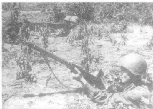
↑ 对边境地区的苏军来说，国境线对面庞大德军的存在并非秘密。