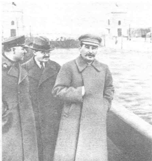
↑《苏德互不侵犯条约》的谈判代表之一莫洛托夫（中间位置）和斯大林在一起。

↓1941年，德军III型坦克越过南斯拉夫边境。德国入侵南斯拉夫和希腊分散了希特勒计划入侵苏联的精力，占用了德国人在苏联冬季到来之前打败斯大林的部分可用时间。