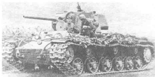
↑KV-1重型坦克是苏军中少数几种设计精良的坦克之一。

心经营起来的战争机器，但当需要在苏联满足其野心的时候，德国的武装力量以及支撑他们的经济基础都显得严重不足。