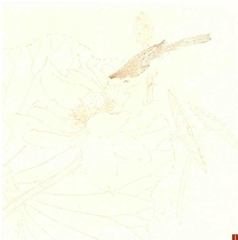
步骤一：根据构图立意确定画面内容，完成描线部分。