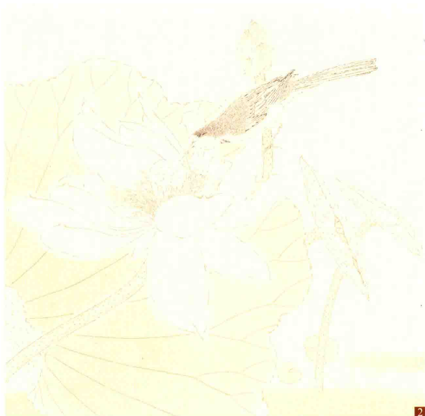
步骤二：先用淡绿色罩染荷叶，烘托花瓣结构。