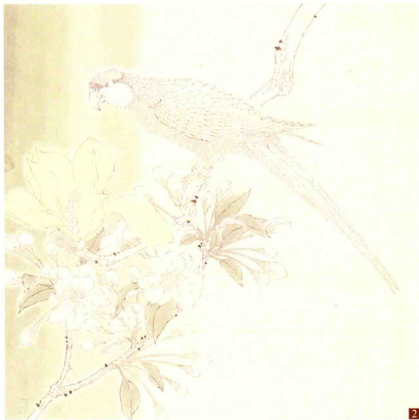
步骤二：先渲染底色营造画面氛围，再染花和叶的颜色。