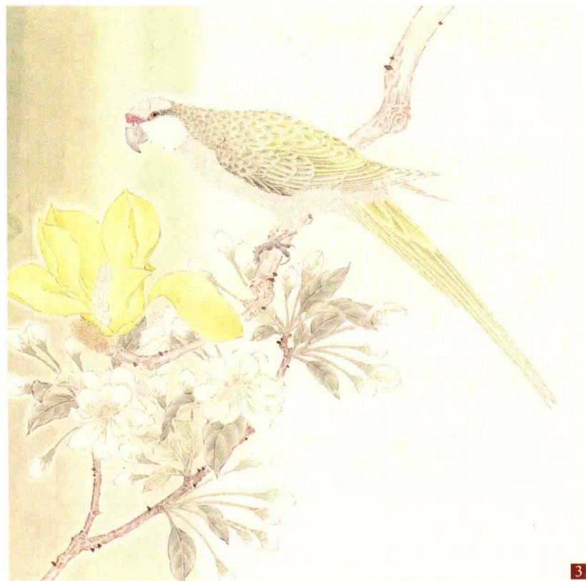
步骤三：进一步深入，染出花的不同颜色和叶子的质感。鸟先从嘴巴、眼睛、爪子开始刻画，然后再分染鸟的体积。