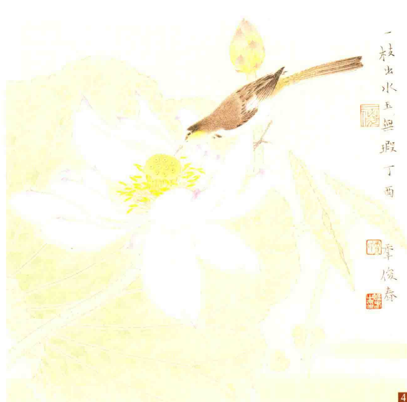
步骤四：重点刻画鹊鸂鸟，特别要注意鸟的虚实关系。白粉提染花瓣，胭脂点缀瓣尖部分，最后全盘收拾画面，题款盖章，完成作品。