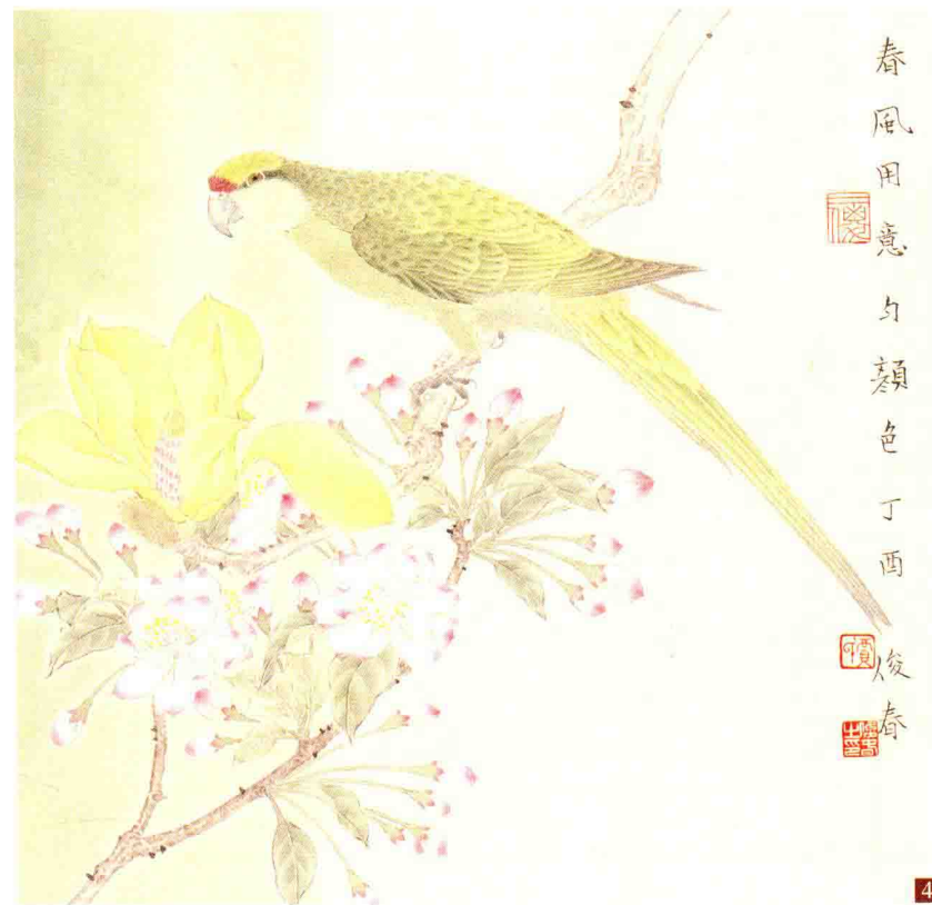
步骤四：最后重点刻画羽毛的色彩变化，要染出鸟的体积，用白粉提染海棠花，胭脂点染花瓣尖部。