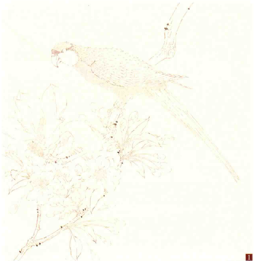
步骤一：根据构思立意，确定画面内容，完成线描。要根据物体的不同质感来运用线条。