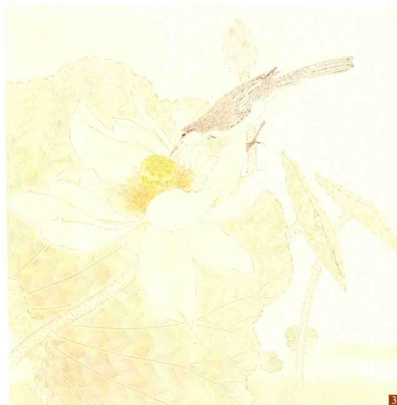
步骤三：深入分染荷叶的叶脉质感，莲蓬用嫩绿分染，用淡绿色分染花瓣结构。