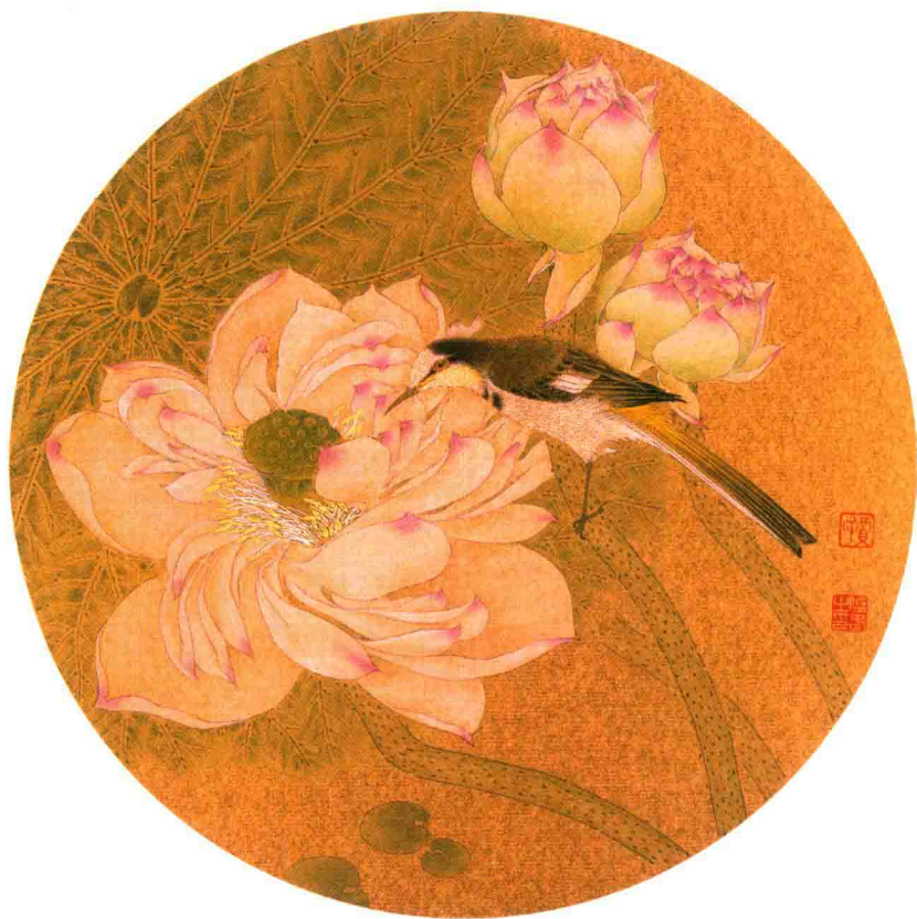
香远溢清 33×33cm 2015年

柳财顺画动物赏析 张贤明画鸟赏析 方政和画鸟赏析 刘德伟画牡丹赏析 颜成彪画荷花赏析