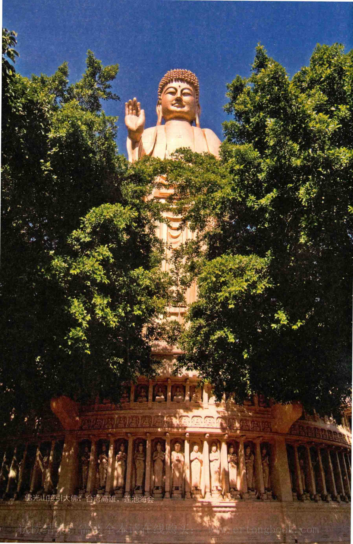
佛光山接引大佛，台湾高雄，莲池海会