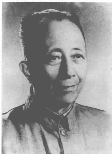
黎锦晖堪称中国流行音乐和儿童歌曲的奠基人，后来在抗战时期也写了不少抗战歌曲

1931年“九一八事变”之后，东北全境沦陷，华北摇摇欲坠，但一些社会流行歌曲，依旧是《何日君再来》《桃花江是美人窝》。这些歌曲主要来自聂耳当时就职的明月歌舞社，社长就是《桃花江是美人窝》的作者、著名的音乐人黎锦晖先生。