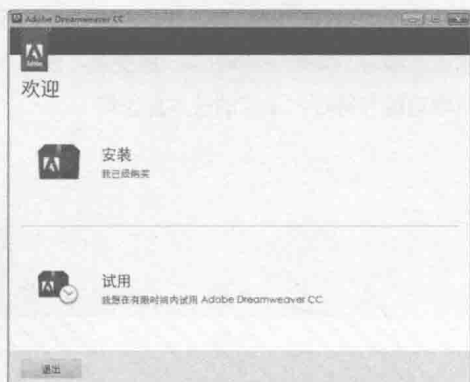
图 1-2 【欢迎】对话框

步骤 3 在【欢迎】对话框中单击【试用】图标，打开【需要登录】对话框，提示用户需要使用 Adobe ID 进行登录，如图 1-3 所示。