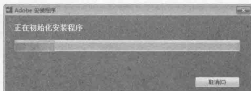
图 1-1 【Adobe 安装程序】对话框

步骤 2 Dreamweaver CC 安装程序初始化后，弹出【欢迎】对话框，如图 1-2 所示。