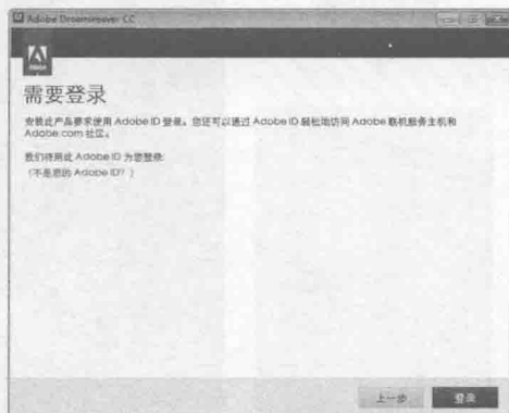
图 1-3 【需要登录】对话框

步骤 4 单击【登录】按钮，进入【Adobe 软件许可协议】对话框，如图 1-4 所示。