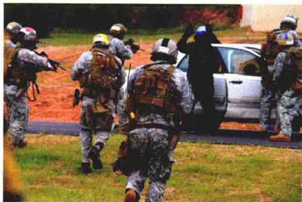
“三角洲”特种部队进行反怖训练