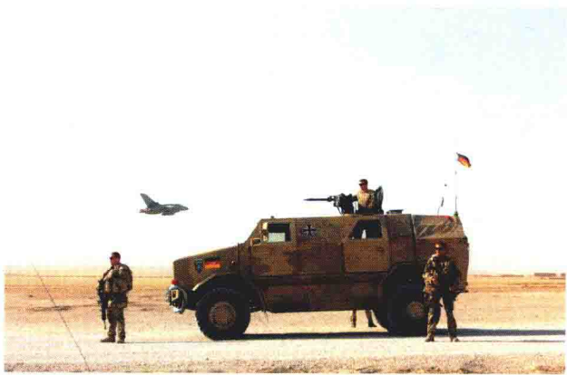
特战队员进行警戒

特战队员往往会借助各种载具前往任务地点，包括装甲车、快艇、直升机等，这些载具必须具有高机动性，才能保证特战队员快速安全地到达任务地点。