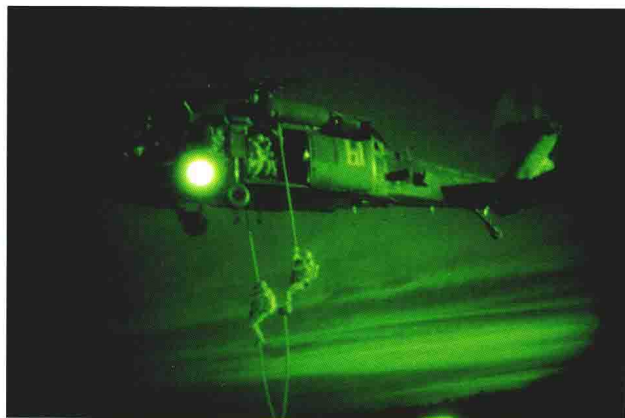
特战队员在夜间进行绳降

特战队员执行任务时，往往需要出奇制胜。他们使用的装备需要有极强的隐蔽性，这样才能避免因暴露而导致任务失败。