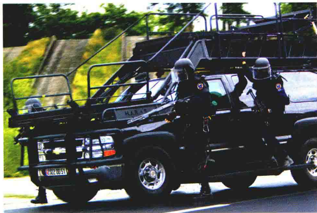
法国国家宪兵干预队装备的装甲车辆

目前，各国特种部队在更多地采用陆、海、空三军通用的轻便、灵活、性能更好的装备的同时，还在积极研制专用和新概念武器，即那些可能改变传统特种作战方式的专用和非致命性武器。如美国国防部已授权成立一个专门机构，研究非致命性武器所需的相关技术，包括激光、微波、声波、电磁脉冲、化学复合物和电脑病毒等。美军成立不久的特种作战研究与发展中心也投入大量资金用于反恐专用武器装备的研制。