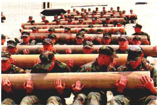
美国海军“海豹”突击队进行体能训练

模拟训练主要分为两种类型。一是采用先进的训练模拟器材，包括用于进行复杂技术装备操作训练的技术模拟器材（如直升机模拟驾驶仪），以及场地或室内使用的对抗模拟器材（如美军的多用途激光交战模拟器）。二是设置逼真的实战环境，即在实地使用假想敌和实物进行训练。如以色列和印度的特种部队在机场的民用客机上进行反劫机实战演练，机内有扮装的乘客和劫机恐怖分子。美军特种部队则按照任务的需要组织受训人员到深山、沙漠、港口等特殊场地与扮装的“游击队”或“恐怖分子”进行非正规战和反恐怖行动训练。此外，美国 and 以色列还尽可能让其特种部队参加实战锻炼，以提高实战能力。