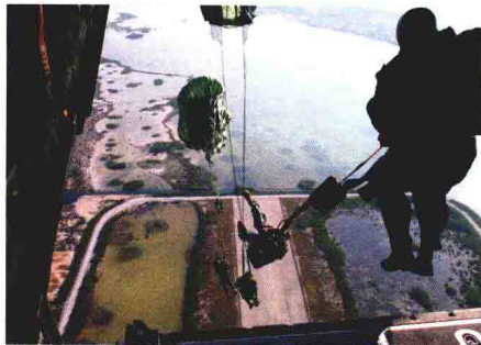
特战队员进行高空跳伞