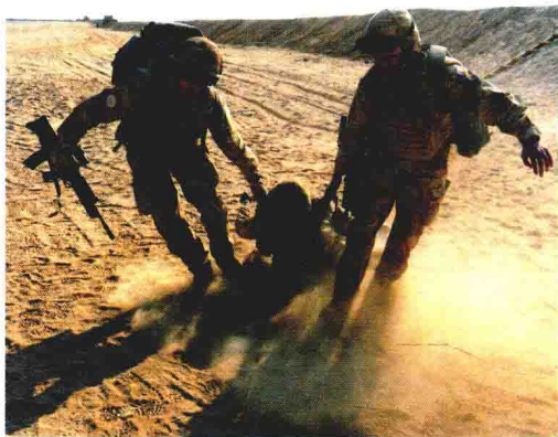
进行战地救援训练的美军士兵

俗民情，熟练操作和维修本国及各国的现行武器装备，驾驶各型军用车辆及坦克和直升机，水下战斗，在丛林、雪地、沙漠和核、生、化条件下的生存与作战的技能，以及战地救护等。