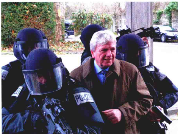
执行要员保护任务的德国 GSG-9 行动小队

各国特种部队的编制一般为大队（群）或团（营），下辖中队、小队或连、排（组）。大队（群）或团（营）编制一般有1200~1500人，中队、小队或连、排（组）编制只有数十人。而组为最小的作战编制，一般为2~15人。如美国陆军特种作战群为1400人，辖54个中队，每个中队仅12人。