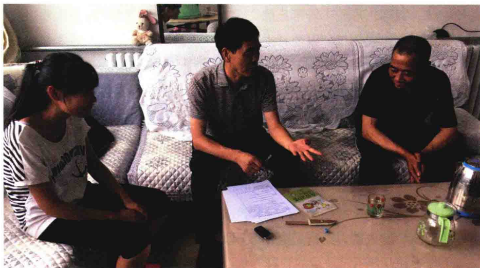
▲ 16 电商高 1 班班主任到怀柔区的学生家中进行家访