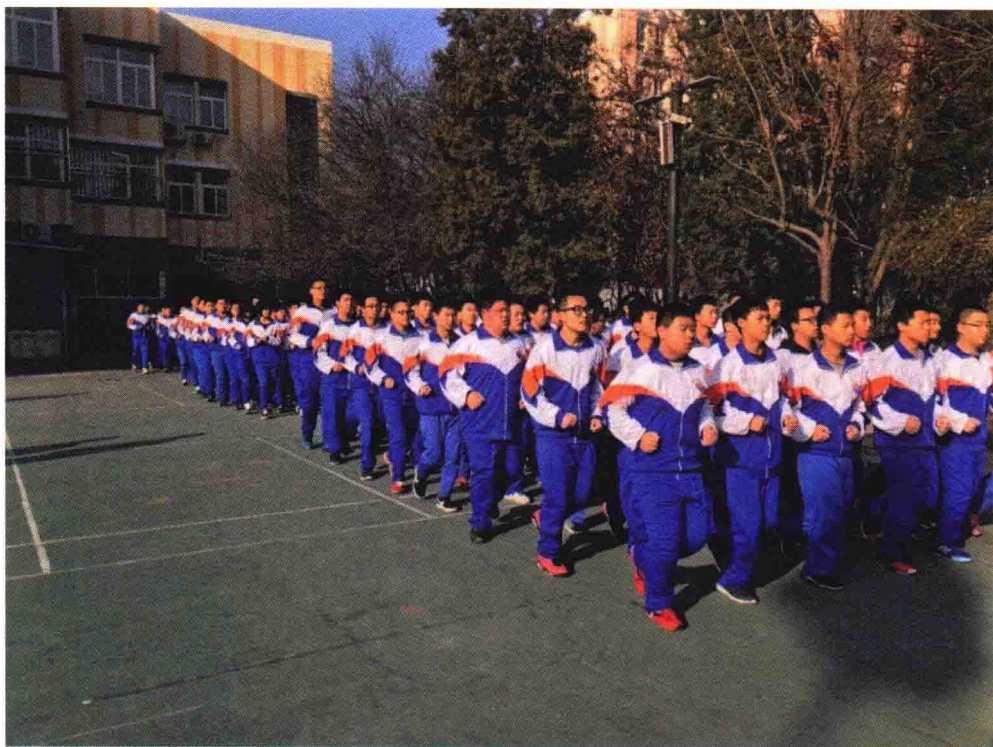
▲ 锻炼团队精神——学生跑操训练