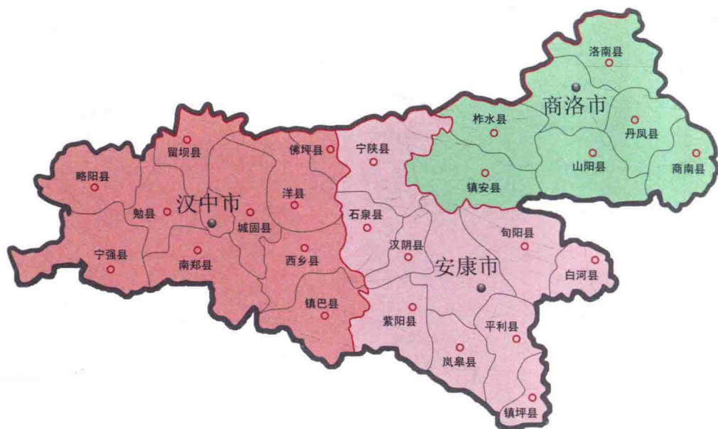
图 1-1 陕南行政地图

陕西省行政管辖区共有陕北、关中、陕南三大区块，陕南地区与关中地区比邻并以秦岭主山脉为界，由于该地区地处陕西省的最南端，故被称为陕南地区。又由于该地域面积较大而自西向东依次