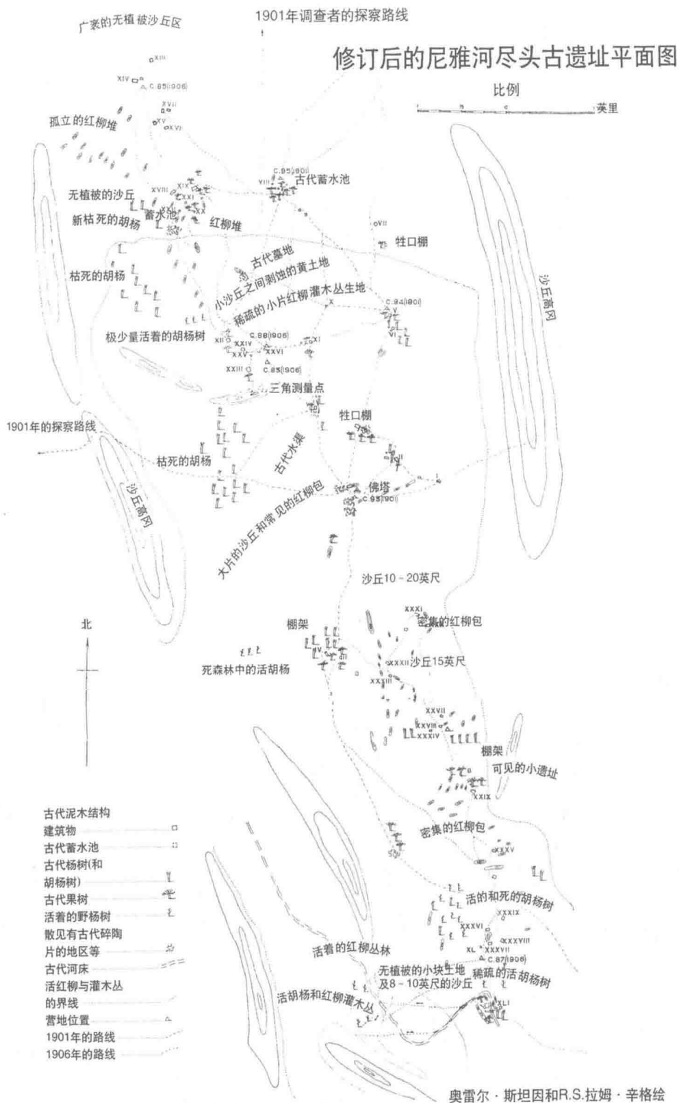
图2 修订后的尼雅河尽头古遗址平面图 ( 采自斯坦因: 《西域考古图记》第三卷附图7, 奥雷尔·斯坦因和 R.S. 拉姆·辛格绘 )