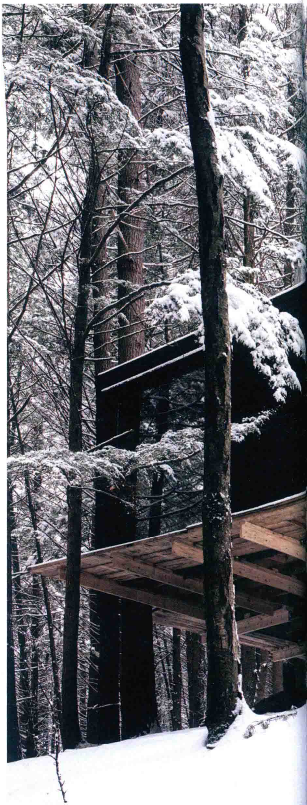
在建中的工作室，手工搭建，带支架。

“比弗溪”建成后不久，我制作了一个名为“木屋之色”的网站。我和几名朋友征集了一些照片，那是我们心目中家应有的模样：用双手搭建，用想象力和易得的材料布置，只要有独特的设计和