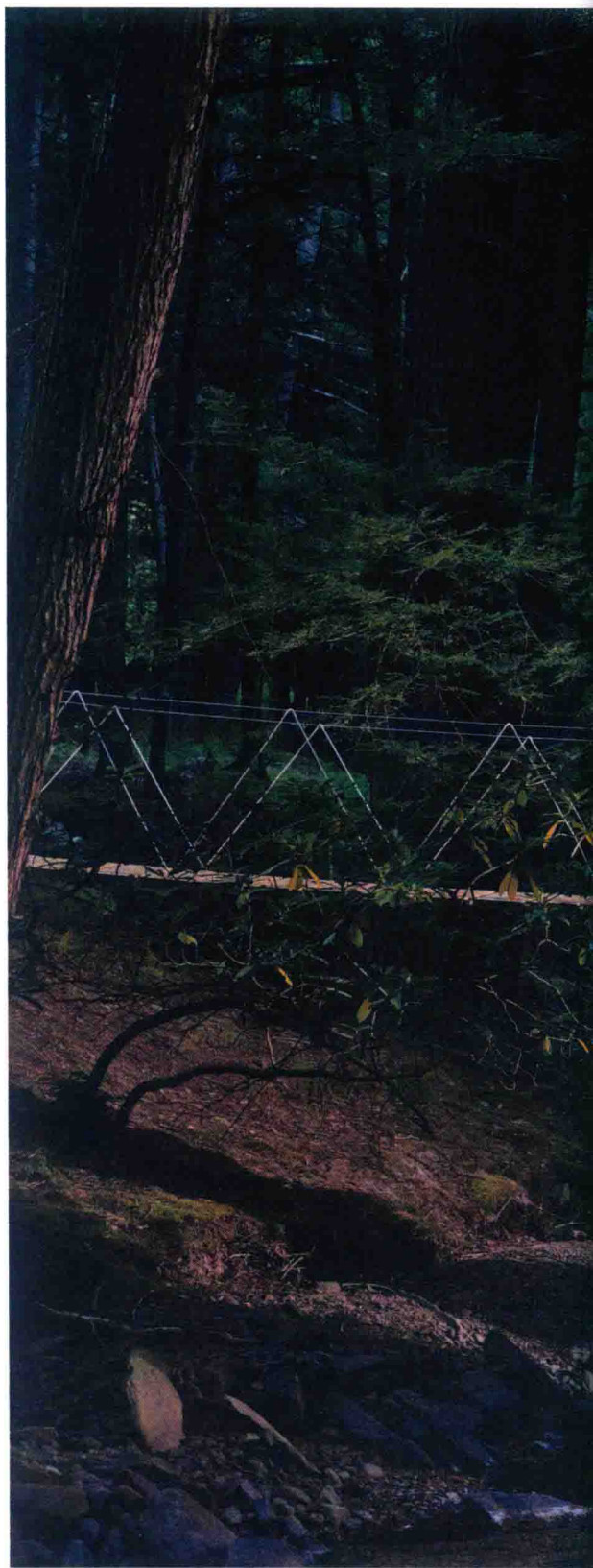
2011年，比弗溪的居民用压力处理过的黄杉木建了一座吊桥，桥的两边设有保护绳。

稍晚一些时候，我们在汽车旅馆的餐厅吃了培根生菜番茄三明治，我拿起手机浏览房产信息。在房产中介的网页上，我看到一处地产的缩略图，那是特拉华河上游2.5英里（4.02千米）处，一片50英亩（20.23万平方米）的待售林地。我立刻知道，就是它，没错了。那片林地上，一条泥路穿过成片的山胡桃树通向一间简陋的棚式木屋，屋里没有通电，也没有管道，下方的小溪流向特拉华河，溪岸边矗立着北美白松，也就是东方红杉，这些树的树龄上百，枝干上扬，裸露的根系和一堆堆长满苔藓的湿滑腐石交错缠绕。