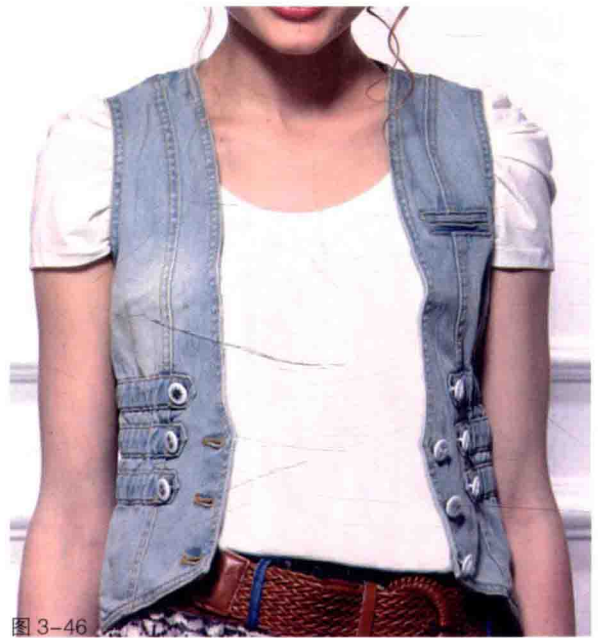
案例八：公主线分割休闲牛仔马甲 049 页