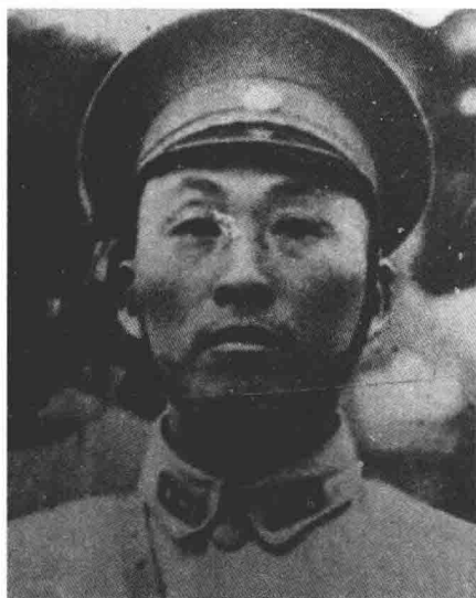
徐庭瑶，保定军校出身，刚开始，他也不熟悉装甲兵，但他知耻后勇，此后努力学习，终成中华民国装甲兵的创始人

徐庭瑶刚要开口，旁边蹦出一位捣乱的，谁呢？何应钦，蒋介石的军政部长。何应钦仗着资历老，先开腔了：“徐庭瑶啊！我事先可跟你说了！铁路是咱们的生命线，如今咱们最大的优势，可就是通过铁路快速输送和投放兵力。如果你的主意是拆铁路的话，我劝你趁早就不