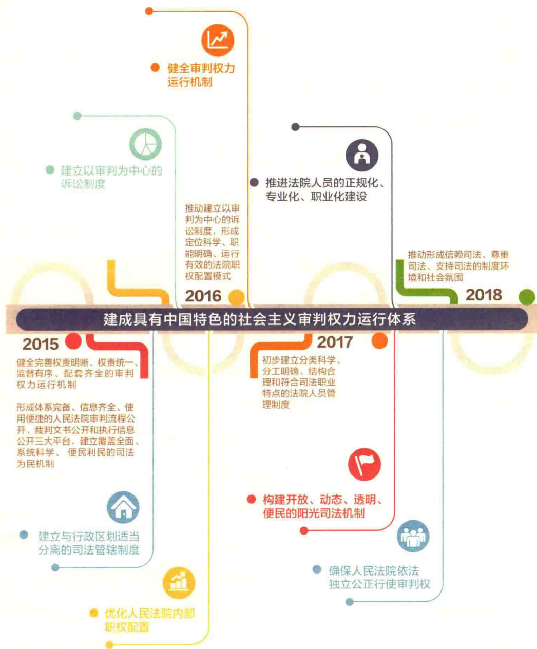
人民法院“四五改革纲要”时间表和路线图