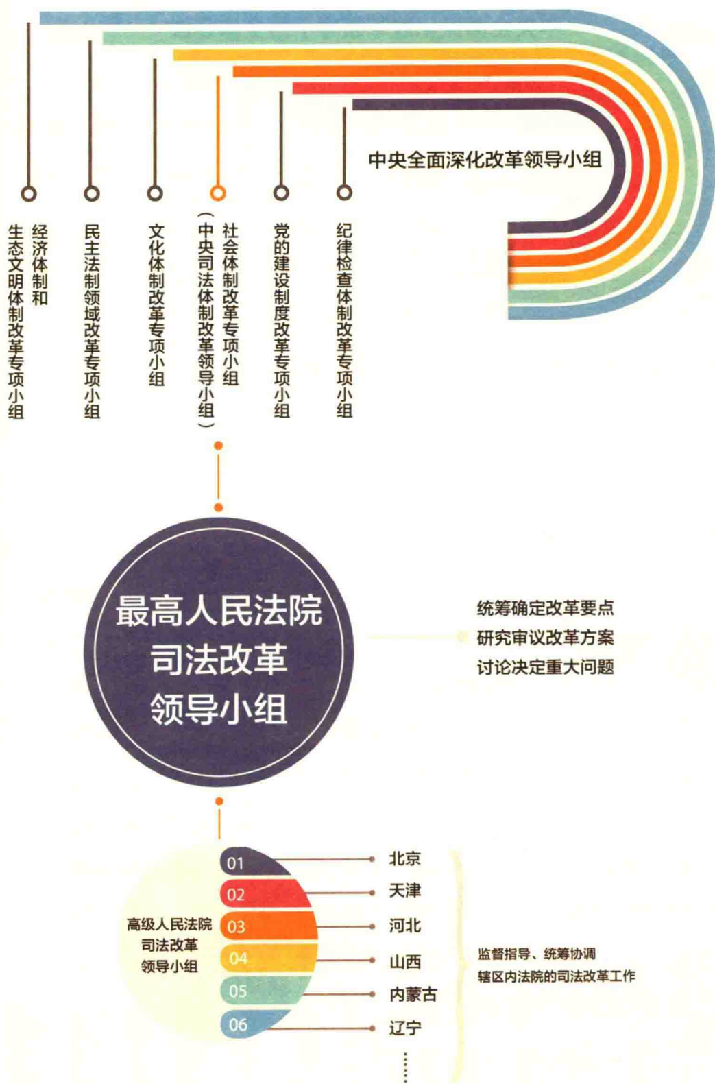
深化司法改革组织实施体系示意图