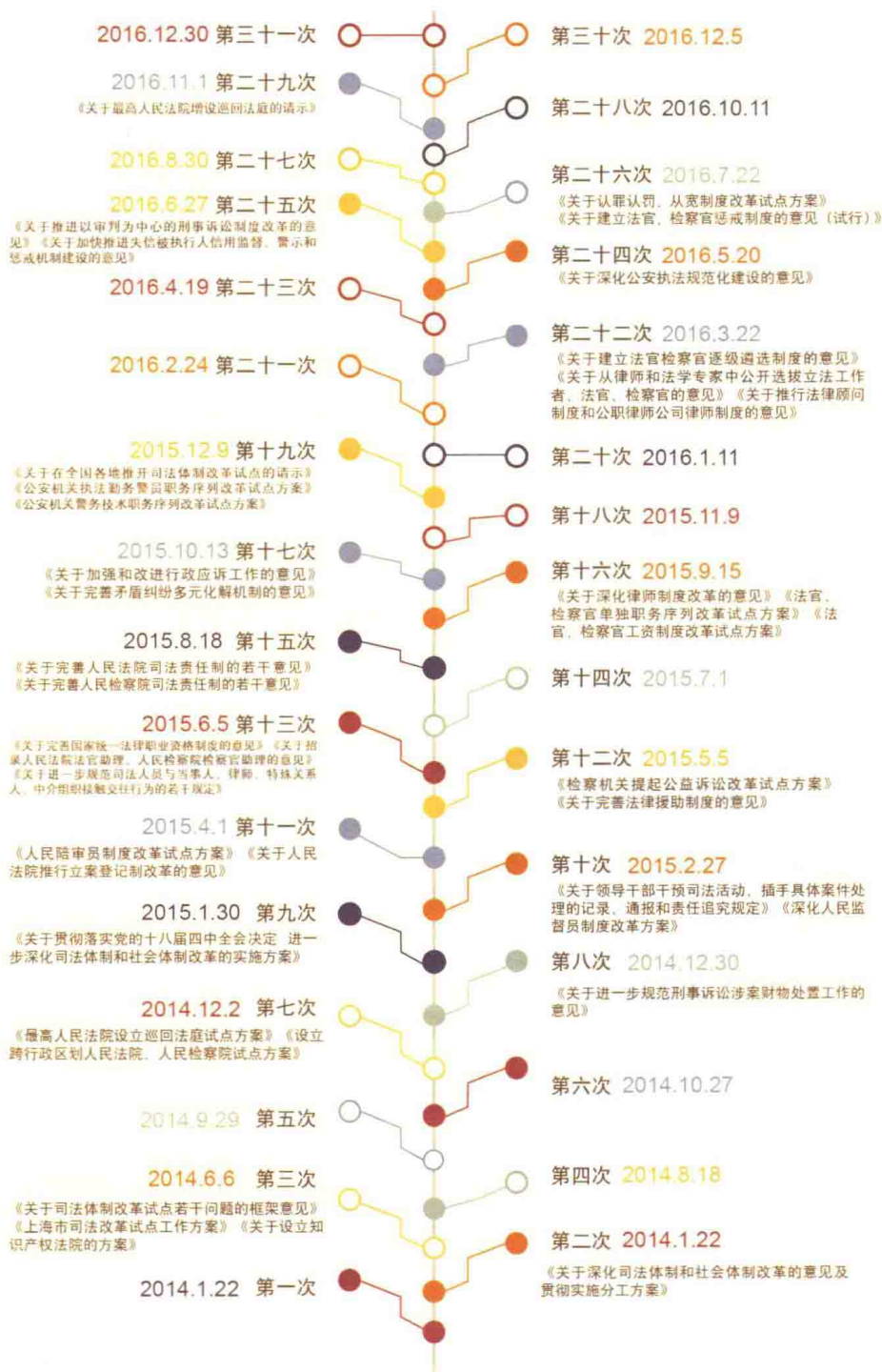
中央全面深化改革领导小组历次会议通过的 司法改革文件示意图（截至2016年12月）