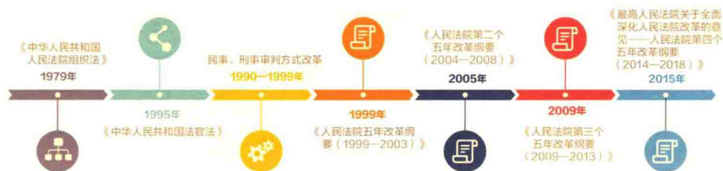
人民法院司法改革时间节点图

形势发展的需要。早在 20 世纪 90 年代，中国法院就开始了以强化庭审功能、扩大审判公开、推进司法职业化建设为重点内容的改革历程。中国共产党第十五次全国代表大会以来，最高人民法院在法院组织体系、法官制度、诉讼程序、审判方式、执行制度、司法管理等方面，开展了一系列改革，并于 1999 年、2005 年、2009 年分别发布了三个“人民法院五年改革纲要”。这三个纲要是 2013 年之前中国法院改革的基本依据。