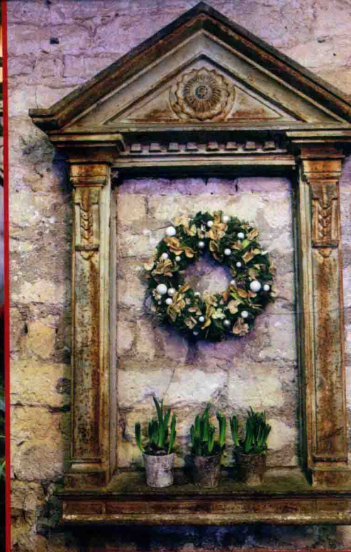
左 / 圣诞的喜悦跃然而出，充满节日氛围的展示摆设。