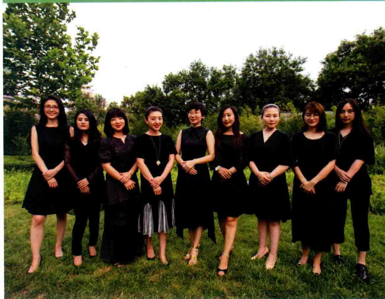
“六朵”团队，从最初的六位女孩到越来越多的“朵儿”加入，六朵从最初的花店品牌，成为女性成长和创业平台。