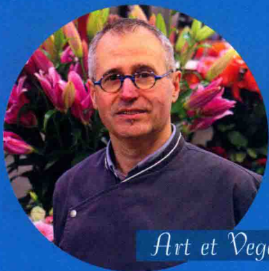
Art et Vegetal 花店