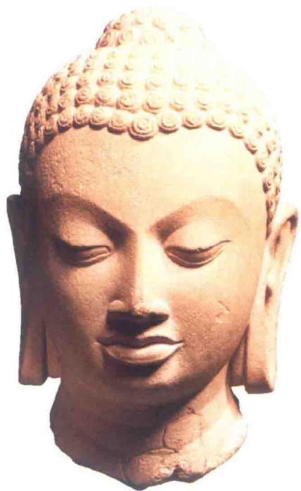
佛陀头像，笈多王朝时期，5世纪

为引导读者穿越迷宫，本书介绍了大约200件跨越许多世纪、代表这个国家不同的地区、王朝、哲学和艺术领域的艺术珍品，用以帮助人们理解印度艺术的迷人故事。所选的作品主