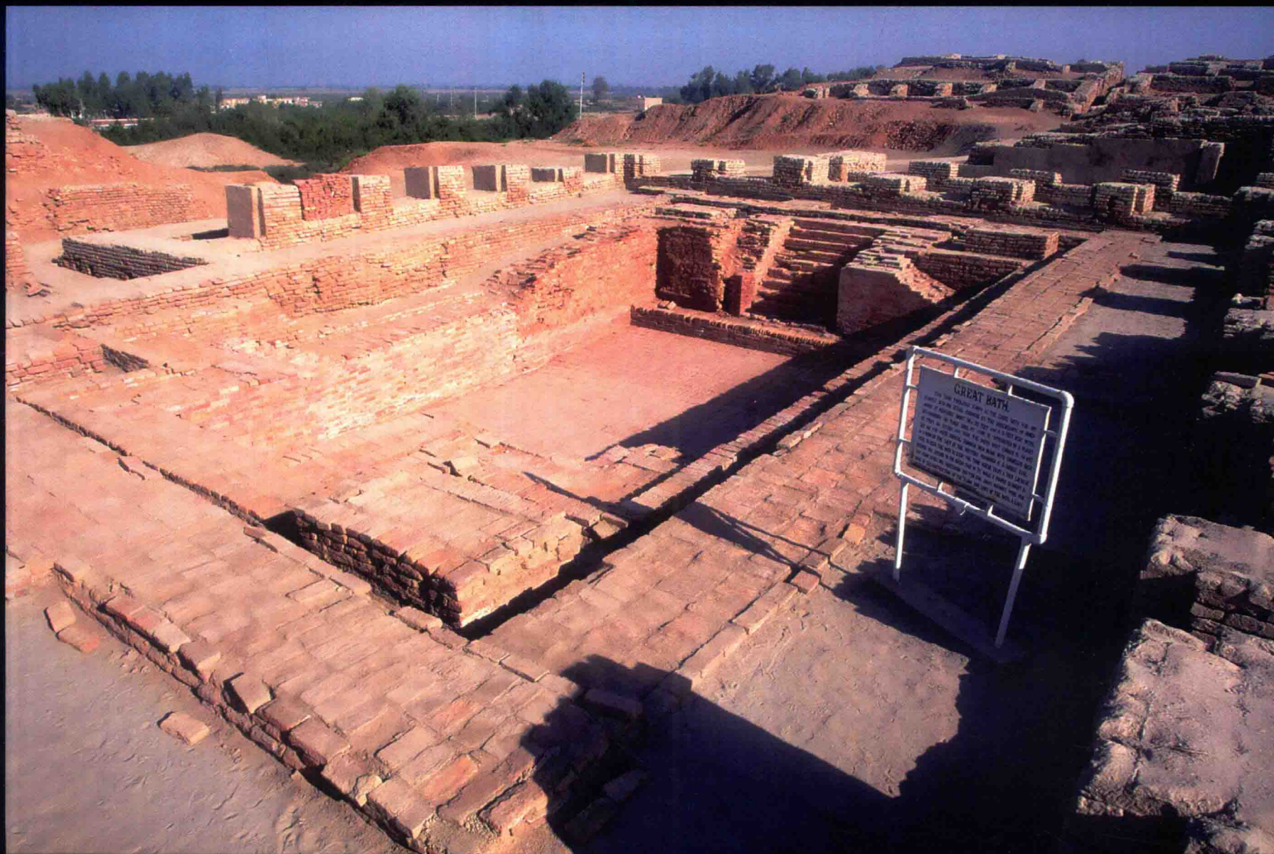
摩亨佐达罗大浴池一景，巴基斯坦，印度河流域文明，公元前3000年