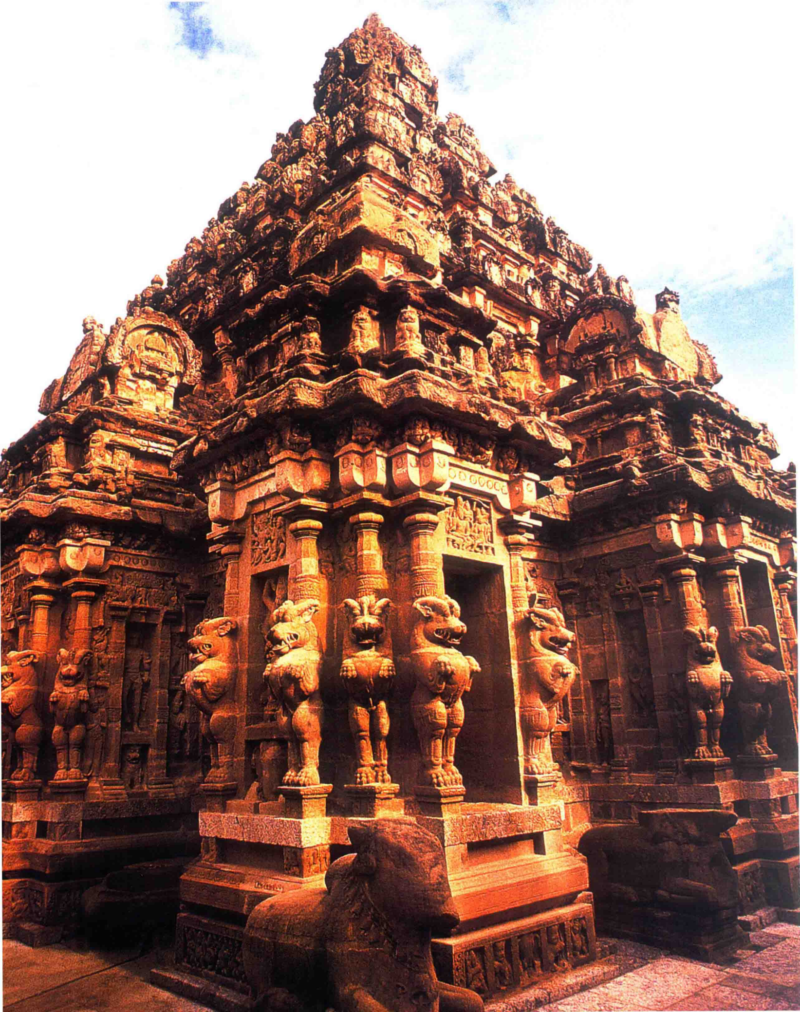
甘吉布勒姆 (Kanchipuram) 的 凯拉萨纳塔神庙 (Kailasnatha temple) : 8世纪