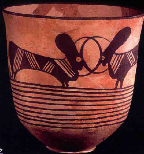
史前时期绘有公牛形象的陶器，印度河流域文明，公元前2500年

大约在3万年前（尽管这个时间尚存争议），上述哲学的起源就体现在温迪亚山脉（Vindhya Range）那个最大的史前石窟群落中，尤其是位于被称为印度心脏的中央邦的比莫贝特卡（Bhimbetka）石窟中。石窟中的岩石艺术是用石头、骨头和树枝蘸取天然颜料（如植物提取物以及混合了水或动物油脂的矿物粉），雕刻、绘制及着色而成。此外，铭文的存在间接证明了曾有前农业时代的群落生活在这里，它是印度次大陆已知最古老的地方之一。在迄今已经探明的642个石窟中，有许多都布满了图画和雕刻，这些描绘着不同种类的动物的图画和雕刻，至今在该地区仍然四处可见。在有些狩猎场景中，还刻画着肩扛木棍、长矛和弓箭的猎人，他们身旁有时还跟着狗、马、鹿等。考古学家发现了一些有趣的图像，涉及母亲神、日常物品、追捕动物、简笔画人物，以及在X光下显现出描绘了内部器官的动物形体。其中，男性人物和舞者被描绘成戴着面具或头冠或角状头