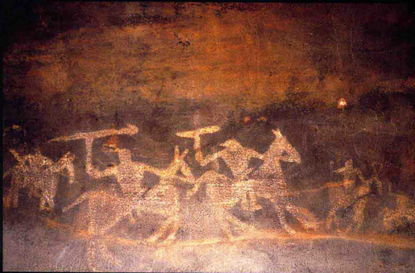
狩猎中手执长矛的骑马者，比莫贝特卡石窟

与考古发现中经常出现的情况相似，这个遗址于1865年被人们发现也是极其偶然的。当时正在修建连接拉合尔与港口城市卡拉奇的铁路，为了给铁路铺设打好地基，附近的土丘变成了砖石的来源。土堆中烧制良好和尺寸统一的砖块，引导考古学家挖掘并发现了哈帕拉城遗址。在遗迹中还发现了雕塑、雕像、珠宝，以及其他实用制品和祭祀制品，如主要用陶土、石头和青铜制作的母亲神、生殖和阳具象征物。一旦铭文中书写的文字得以破译，这个时期更为清晰的文化图景就将浮现出来。同时，挖掘和研究工作，将这些考古发现与古老的印度河流域文明联系起来。这一文明曾盛行于约100万平方公里的广阔区域，从阿富汗的高原地区穿过巴基斯坦的部分地区一直到古吉拉特邦的沿海地区。其繁荣的文化持续了近2000年的岁月，它的衰落似乎出现在公元前2000年的末期，可能是由于印度雅利安人（IndoAryans）的入侵或这一地区的生态变化引起的。雅利安人的入侵和最终定居带来了一种文化，这种文化将雅利安的哲学思想和社会意识与当地达罗毗荼人（Dravidian）的主流文化相融合，从而为吠陀传统奠定了基础。