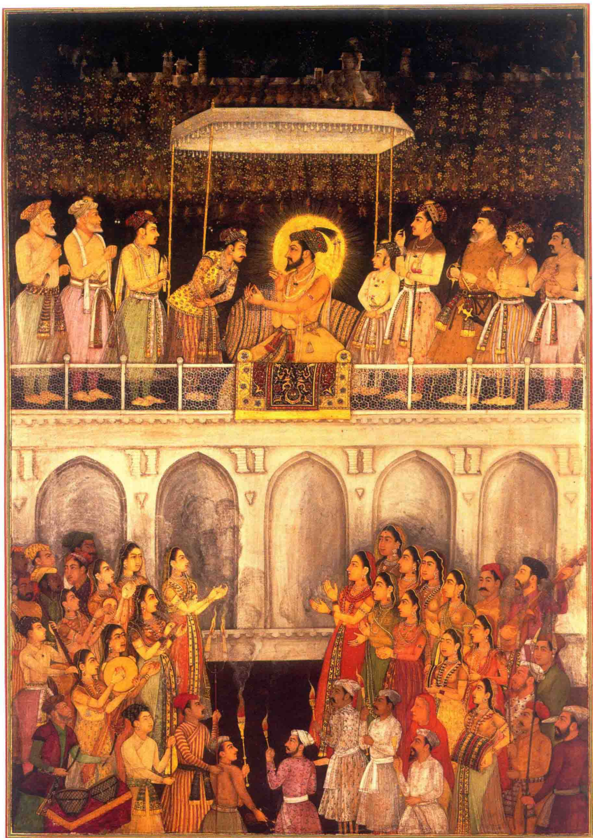
沙贾汗在其婚礼上接受奥朗则布的祝贺，阿布杜勒·哈米德·拉合里（Abdul Hamid Lahori）为《莫卧儿帝王编年史》（Padshahnama）所作的插图，1640年