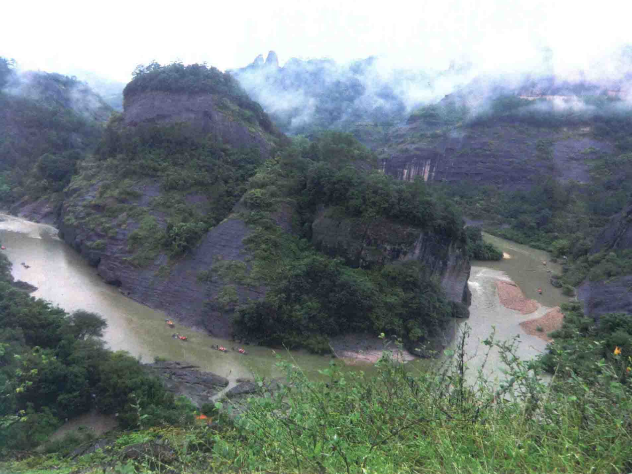
◇ “风景奇秀甲东南”的武夷山

贡茶。直到明初，洪武二十四年（1391），罢造龙团改制散茶。明朝的武夷茶已代替了北苑茶，改变了加工工艺，成为品质优异的散茶，誉满天下。所以，元朝以后的福建贡茶以武夷茶为最多，约占全国贡额的1/4。五口通商后，武夷茶大量出口，促进了武夷茶的快速发展。武夷山位于福建与江西相邻的边界，产茶历史悠久，自蔡襄以后，山中所产的茶叶除寺僧供献游客外，主要作为贡品。元末明初罢贡之后仍为世人所重，争先恐后地购销于国内外市场，成为世界闻名的茶叶。约在十六七世纪，英国、荷兰等欧洲国家的贵族阶层，已把饮用武夷茶作为集会宴客的一种高尚礼节，事后逐渐推广到各阶层的人们中去。茶叶成为欧美各国普遍的饮料之一，从而使我国