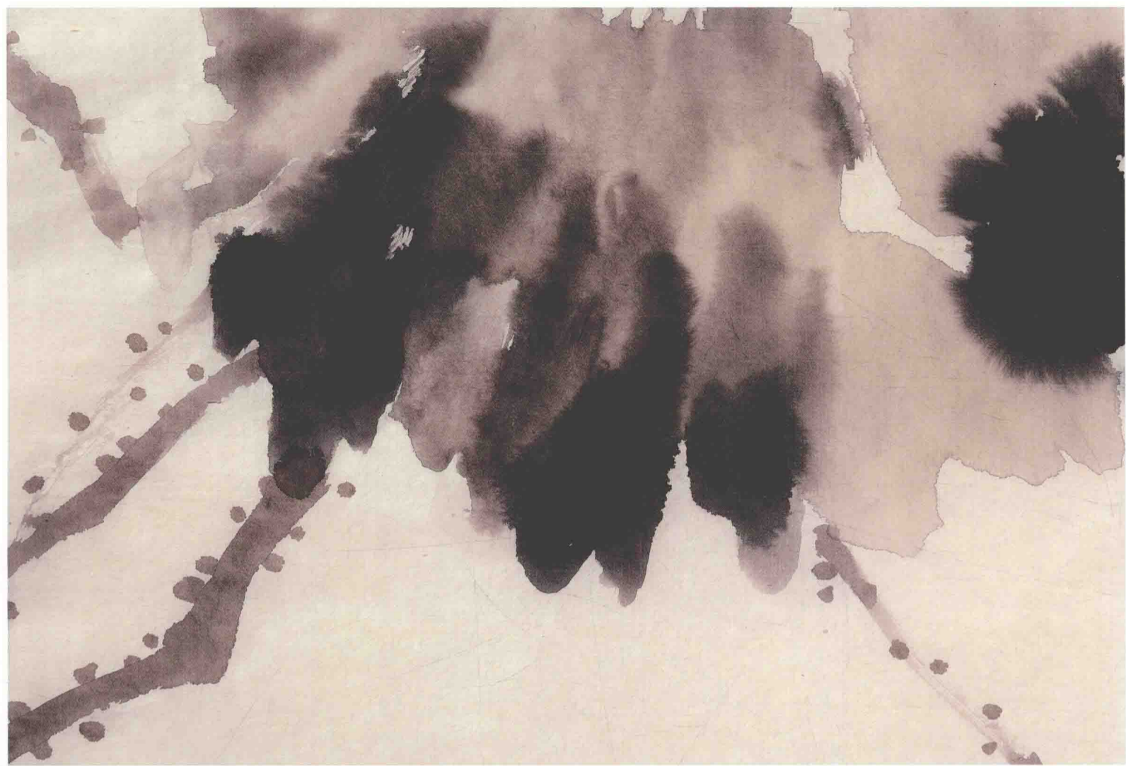
七、荷叶的局部，浓淡墨相融，产生互相渗化的感觉。