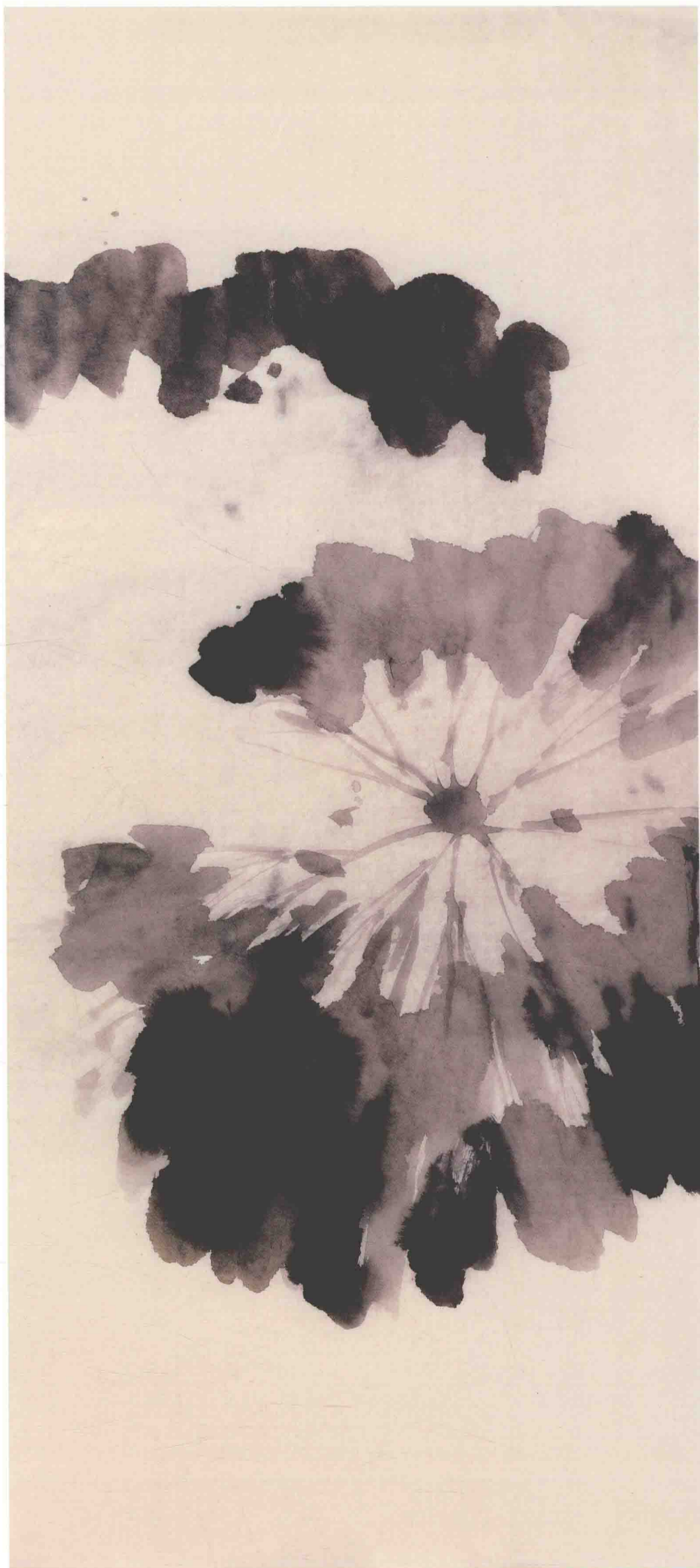
四、侧面的荷叶，用蘸墨法写之，笔笔分明又能融于混沌，注意与正面荷叶的空间关系。