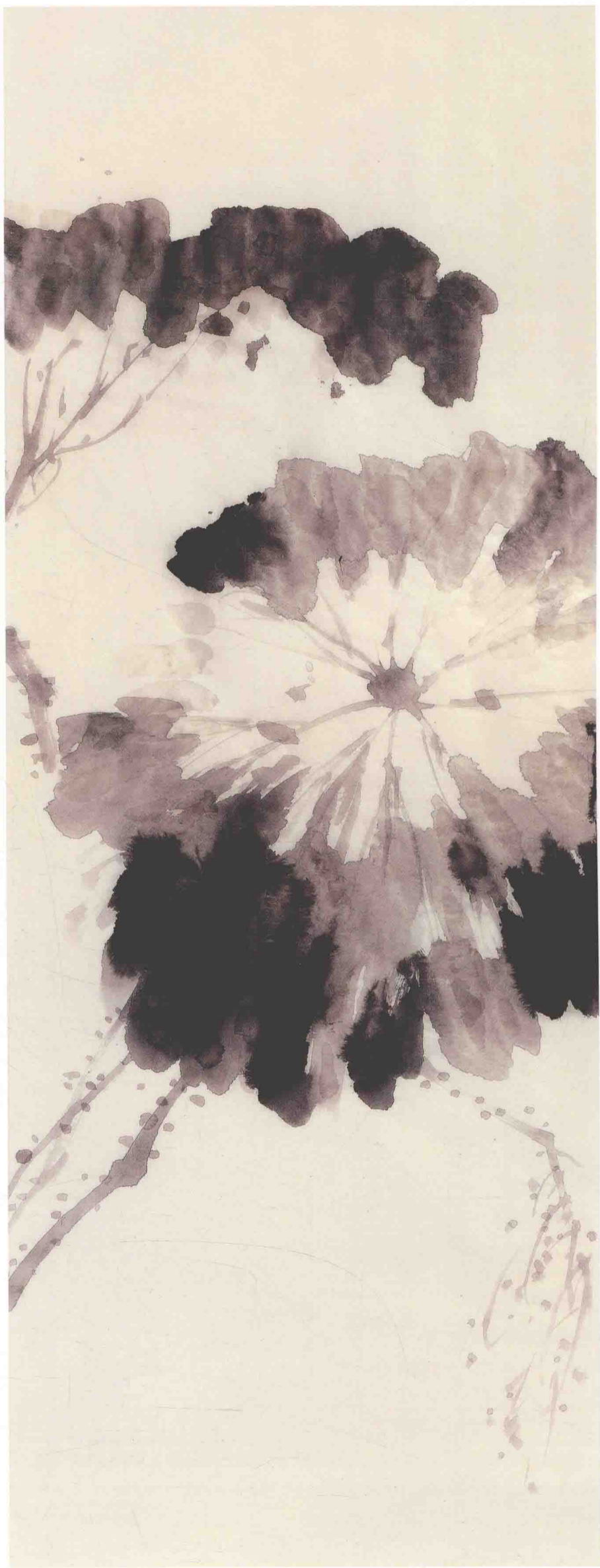
六、勾点荷秆的刺，多是圆点，轻松而又疏密有致，与荷杆要若即若离。