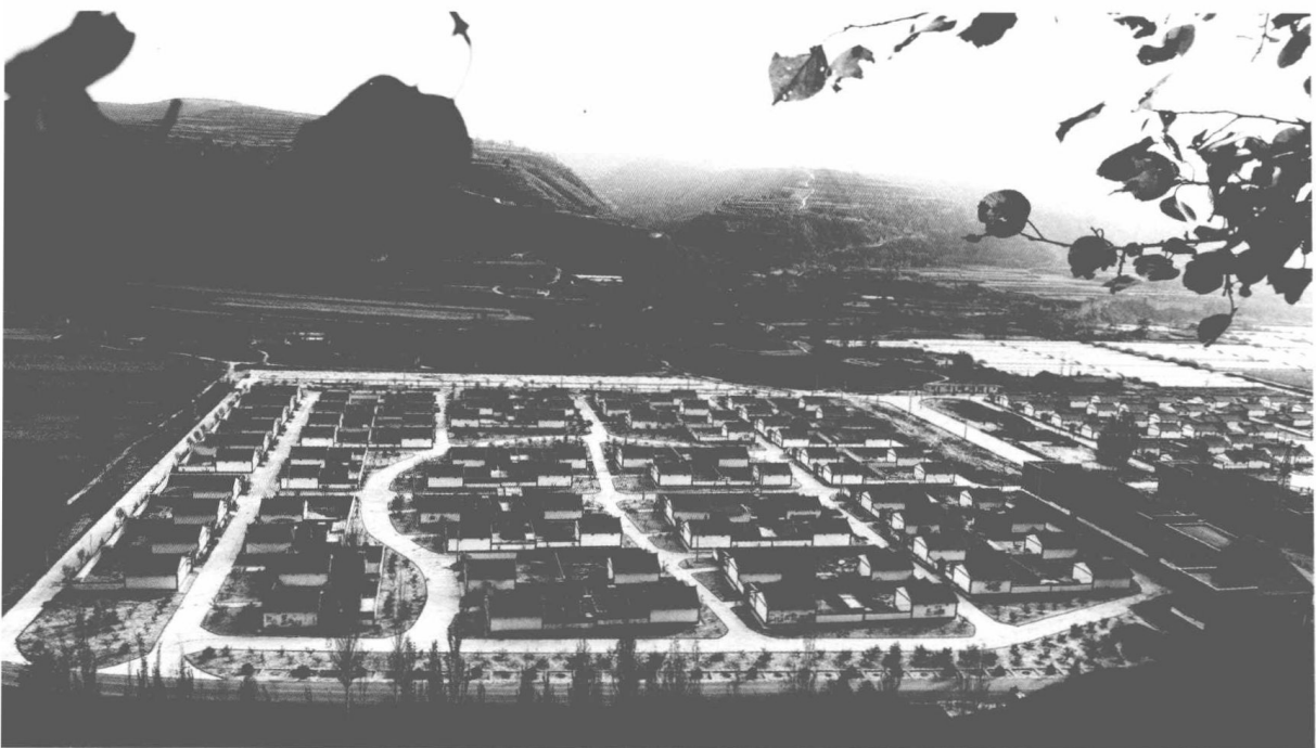
▲ 宁夏彭阳县东彭生态移民新村